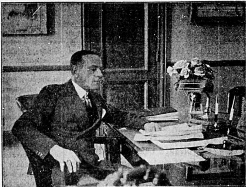
L'HONORABLE ATHANASE DAVID

Qu'ils surveillent avec bienveillance le travail de l'enfant à la maison, qu'ils l'encouragent, qu'ils lui fassent, au besoin, réciter la leçon du lendemain, qu'ils portent intérêt à ses études, qu'ils se renseignent auprès de l'institutrice et ac-