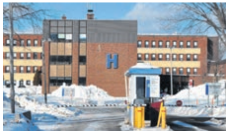
Une très bonne note pour le Centre de santé de la Gaspésie.

À noter que les normes relatives aux soins, à la gouvernance, au leadership et à la gestion des médicaments ont été évaluées, mais que les normes relatives aux services sociaux (programmes jeunesse, réadaptation et santé mentale par exemple) seront l'objet d'une prochaine évaluation.