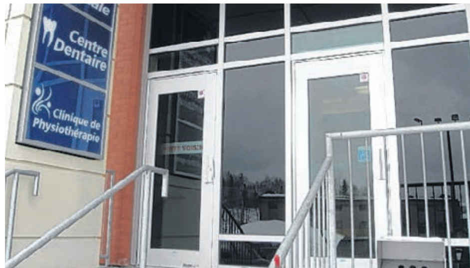
Pour l'ensemble de la province, le taux d'inscription à un médecin de famille atteint 79 %, alors. Quelques régions ont dépassé la cible de 85 % et la Gaspésie en fait partie avec un taux de 87,9%.

Agrément Canada souligne également en terminant deux exemples de programmes dignes de mention avec Faisons équipe contre le cancer et Ensemble on s'occupe de notre monde. Un sommaire du rapport est disponible ici alors que la version complète peut être consultée à cet endroit.