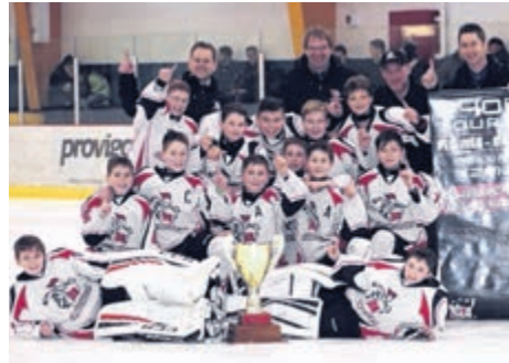
Les Gladiateurs de la Baie ont remporté un beau match par jeu blanc contre les Prédateurs.