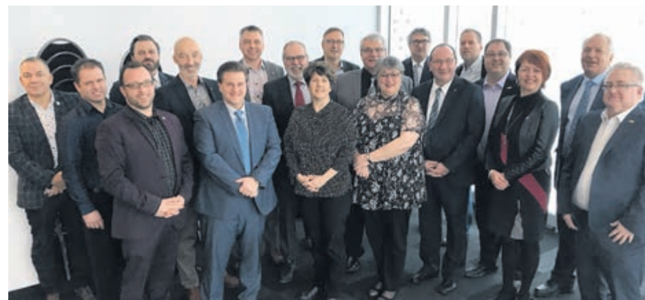
Les membres du Comité sur les aéroports régionaux de l'UMQ.

Rappelons que l'aéroport de Bonaventure est sous la gestion du Ministère des Transports. Toutefois, la Ville désire s'impliquer activement, car il y a beaucoup de possibilités de développement autour de cette infrastructure essentielle à l'essor économique de la région. (A.L.)