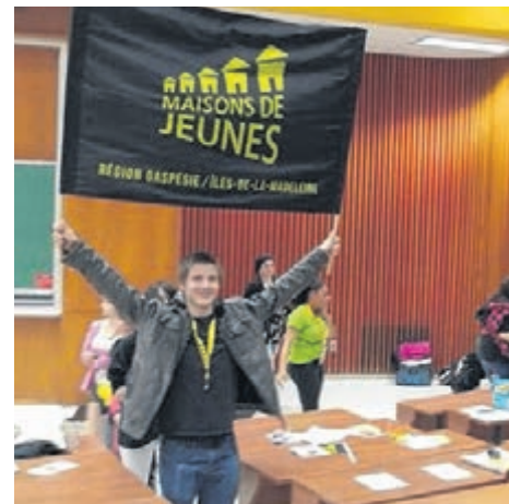
Les Maisons des jeunes sont en difficulté financière en Gaspésie...

Selon le Service Jeunesse du CISSS de la Gaspésie on retrouve des Maisons des jeunes dans la région: Maison des jeunes de Grande-Rivière, Maison des jeunes de Chandler, Maison des jeunes de Rivière-au-Renard, Maison des jeunes de Gaspé, Maison des jeunes l'Oasis-Jeunesse de l'Estran, Maison des jeunes la Cellulose de Murdochville, Maison des jeunes de Sainte-Anne-des-Monts, Maison des jeunes l'Entre-Temps de Cap-Chat, Maison des jeunes de New Richmond, Maison des jeunes de Saint-Alphonse, Maison des jeunes de Caplan, Maison des jeunes de Bonaventure, Maison des jeunes de Saint-Elzéar, Maison des jeunes