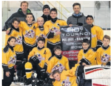
La formation des Aigles Pêcheurs de New Richmond.