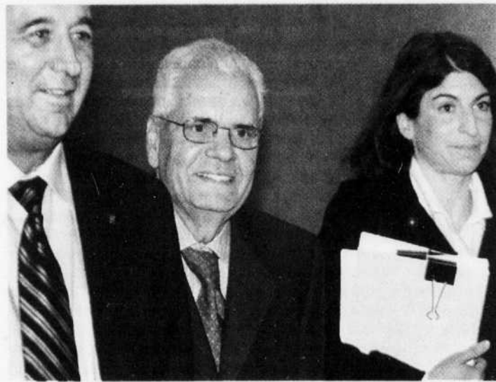
Alfonso Gagliano, au centre, réclame 8,5 millions du gouvernement fédéral à la suite de son renvoi comme ambassadeur au Danemark.