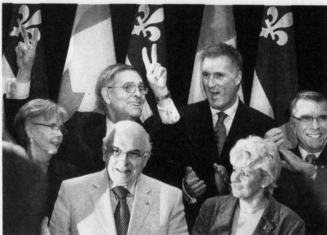
Le député Maxime Bernier (à l'arrière, au centre) a été le plus chaleureusement applaudi.