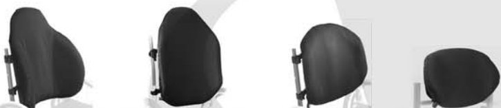
Evolution Deep Evolution Tall Evolution Reg Talon

Le procédé Varilite® est un procédé breveté, unique Les qualités de l'air associées au meilleur de la mousse