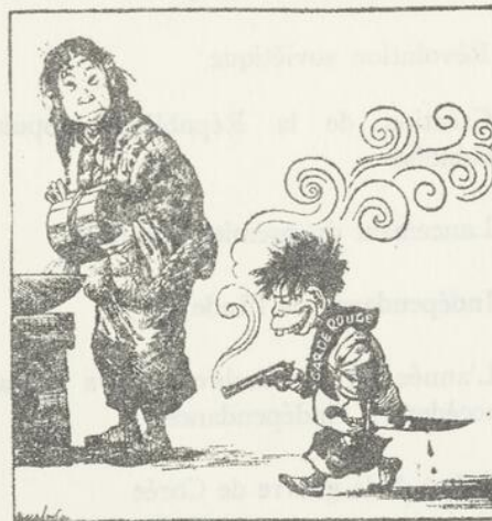
"J'ai bien employé mon congé scolaire, aujourd'hui..."