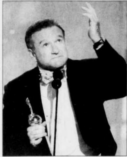
Robin Williams, prix Cecil B. De Mille pour « l'ensemble de son œuvre »

27 millions d'Américains l'an dernier. Prochaine étape à surveiller de cette saison des récompenses : le dévoilement des finalistes aux Oscars, le 25 janvier.