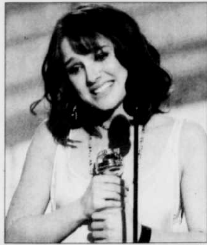
Natalie Portman a été élue la meilleure actrice de soutien dans « Closer ».