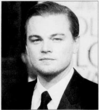
Leonardo DiCaprio a pris le sien : meilleur acteur, dans « The Aviator ».