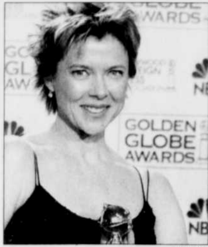
Annette Bening a remporté le prix de la meilleure actrice dans une comédie.