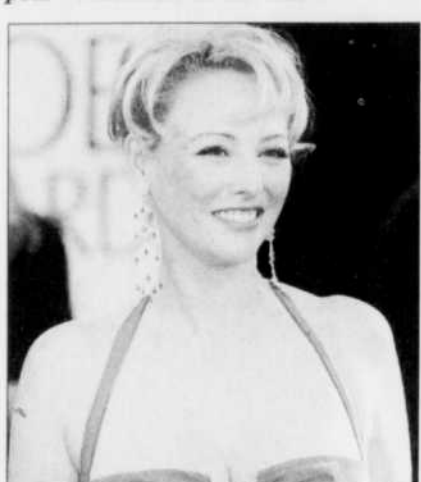
Virginia Madsen a échappé le prix de la meilleure actrice de soutien.