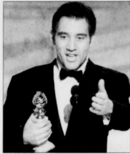
Clive Owen est choisi meilleur acteur de soutien... dans « Closer » lui aussi.