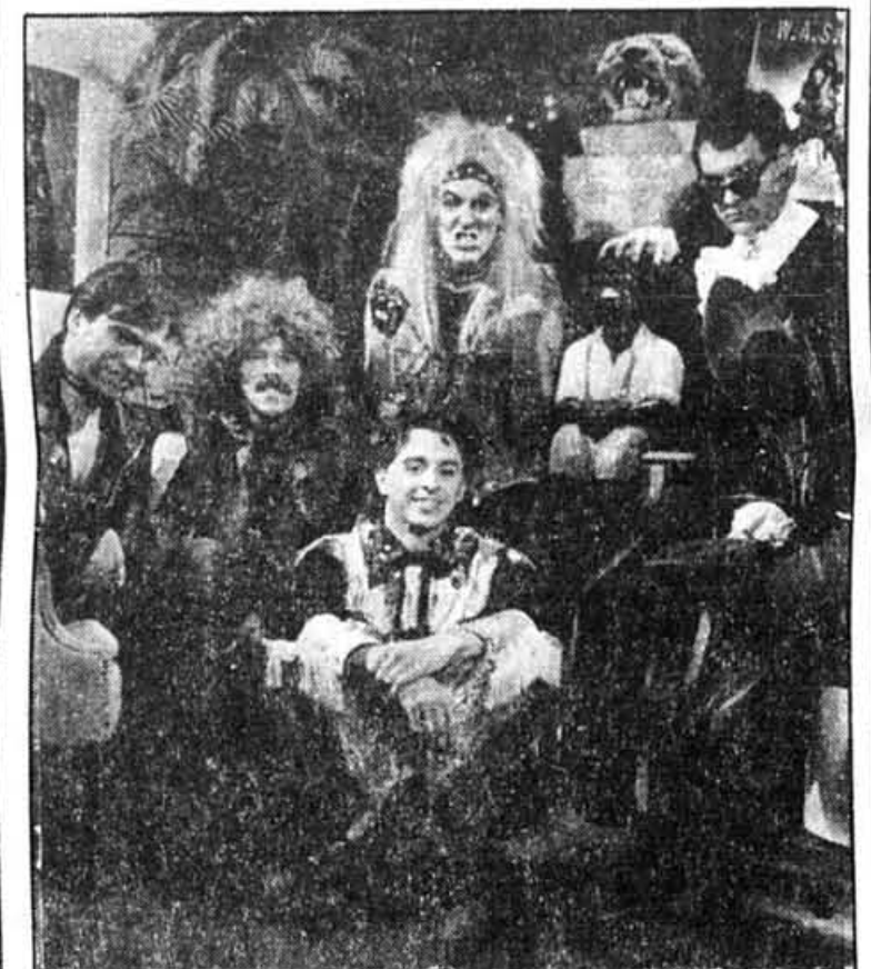
Les vidéo-jockeys de Moche Music: André Ducharme, Richard Sirois, Guy Lepage et Bruno Landry. Assis: Yves Pelletier. Il s'agit du groupe Rock et Belles Oreilles.