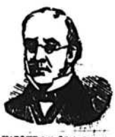
MARQUE DE COMMERCE