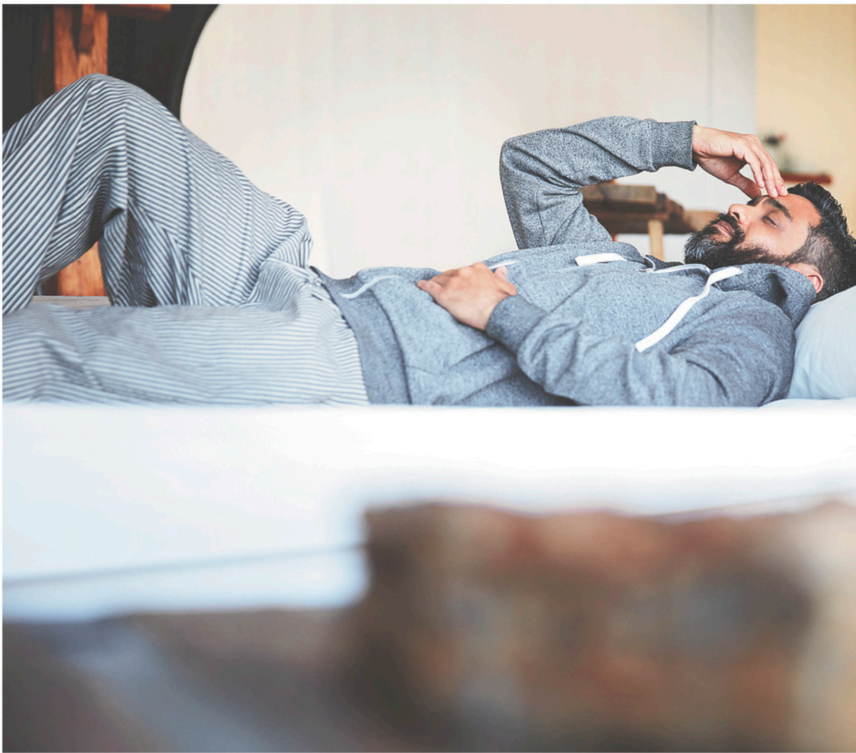
L'homme perd 1 % de sa testostérone à partir de ses 35-40 ans, tandis que la femme voit ses œstrogènes et sa progestérone baisser nettement en un temps court, de trois à cinq ans, autour des 50 ans.