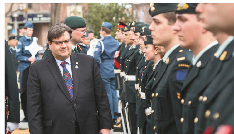
En même temps que la cérémonie de commémoration de la bataille, Montréal inaugurerait sa toute nouvelle place de Vimy, dans Notre-Dame-de-Grâce.

Avec La Presse canadienne Agence France-Press