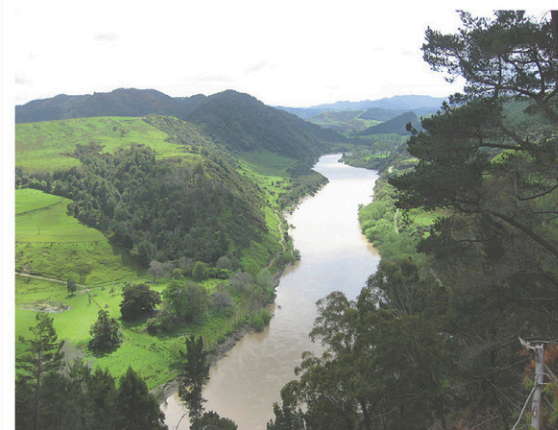
Le fleuve Whanganui, en Nouvelle-Zélande, est le premier fleuve à avoir obtenu un statut légal.