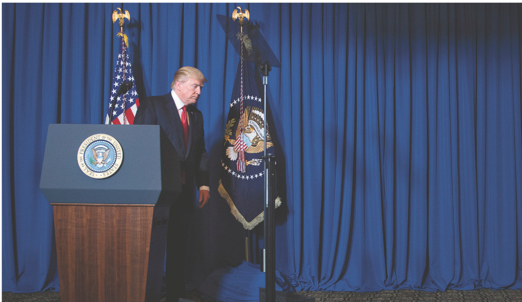
Le président Donald Trump à la suite de son discours sur la nécessité d'une intervention militaire en Syrie le 6 avril, à Mar-a-Lago

Candidat désireux de mettre fin aux ingérences américaines à l'étranger, Trump laissait prévoir une politique nouvelle en Syrie. Mais il est aux abois depuis son élection. L'establishment néoconservateur et néolibéral, maître de l'« État profond », des services de renseignements et des médias, met à mal cet intrus par des allégations incessantes d'accointances coupables avec la Russie. Le président serait à la solde de l'étranger. Une épée de Damoclès pend au-dessus de sa tête, l'exposant au chantage, non de la Russie, mais de ses adversaires qui flairent la destitution (impeachment). L'opération consiste à le mettre au pas et le retour-