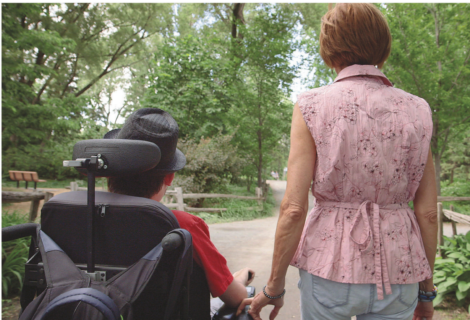
Le film suit ces escortes qui aident les personnes handicapées à se «reconnecter» avec leurs corps.