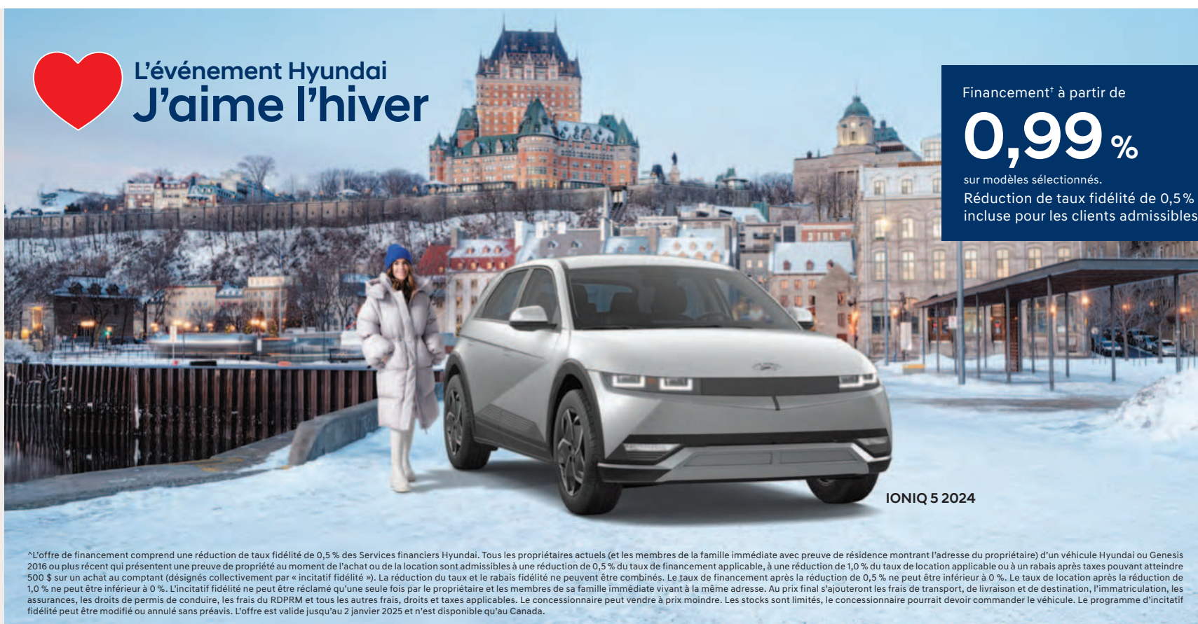
IONIQ 5 2024

Réduction de taux fidélité de 0,5% incluse pour les clients admissibles*.