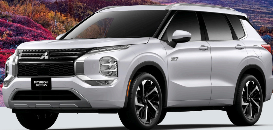
OUTLANDER PHEV GT S-AWC 2025