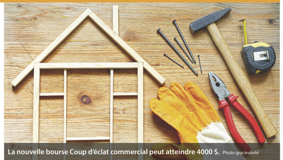
La nouvelle bourse Coup d'éclat commercial peut atteindre 4000 $. Photo gracieuseté

- Sonia Dumais, conseillère principale en développement économique à la MRC des Jardins-de-Napierville