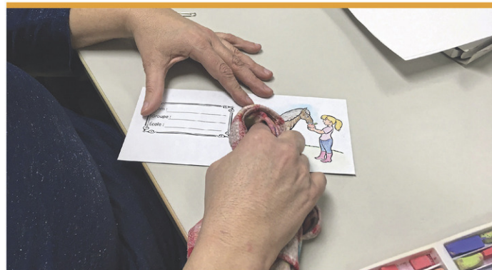
Une ambiance chaleureuse et conviviale vous attend chaque semaine au Courrier Plume, au sein de l'équipe de bénévoles formés.

En tout temps, les femmes peuvent prendre un rendez-vous téléphonique avec une intervenante du Centre pour ventiler, briser leur isolement ou encore demander des références. Les intervenantes sont disponibles pour soutenir les femmes, peu importe les problématiques qu'elles traversent. Au besoin, elles sont référées à des ressources du milieu. Info.: 450 346-0662 ou www.cfhr.ca.