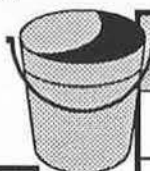
Tableau # 2

Également, on peut corroborer cette affirmation en regardant le Tableau # 2 qui dépeint la performance américaine depuis les quatre dernières années. En effet, le printemps plus froid qu'a connu les régions acéricoles américaines s'est avéré propice à la production de sirop aux États-Unis.