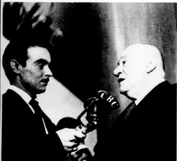
Henri Bergeron semble bien à l'aise pour interroger l'une des personnalités les plus populaires de la Métropole, S. H. Camillien Houde, maire de Montréal et familièrement appelé Monsieur Montréal.

■ Au cours de ces dix années de télévision, Henri Bergeron, premier annonceur sur nos écrans canadiens, est devenu notre grand annonceur. Les années ne l'ont pas vieilli, mais elles l'ont grandi et sa popularité s'est affermie de jour en jour. Qui, de nos jours, ne connaît au Canada français Henri Bergeron? Qui, surtout, ne lui décerne pas d'éloges à la seule évocation de son nom? Des premiers artisans de la télévision, beaucoup ont cessé de faire parler d'eux. Lui est resté l'« annonceur » de la télévision.