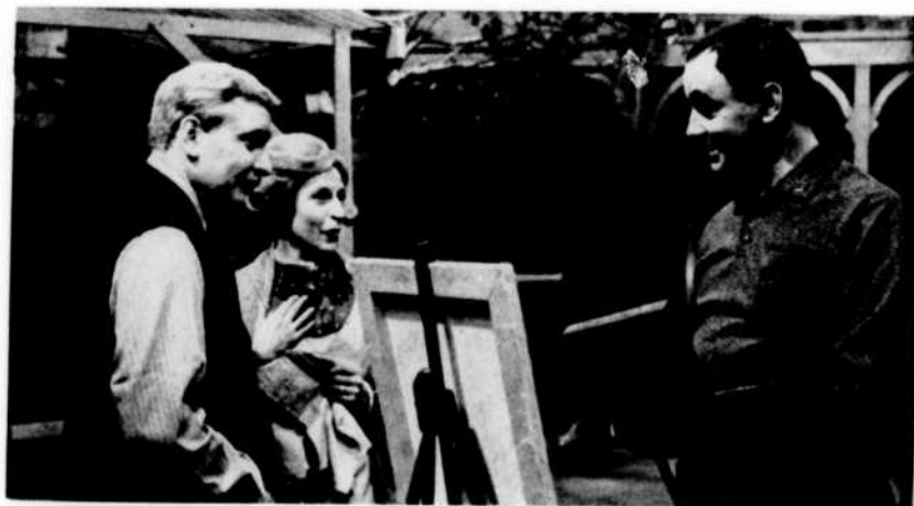
Jean Duceppe, Janine Sutto et Yves Létourneau, vedettes du drame de Marcel Dubé Le Temps des lilas qui sera joué le 2 septembre à la télévision suisse.