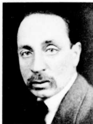
Rainer Maria Rilke