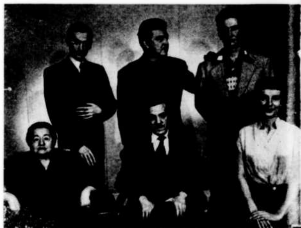
La Famille Plouffe réunie pour la photo de famille. On reconnaît assis: Amanda Alarie, Paul Guèvremont, Denyse Pelletier; debout: Jean-Louis Roux, Émile Genest et Pierre Valcour.