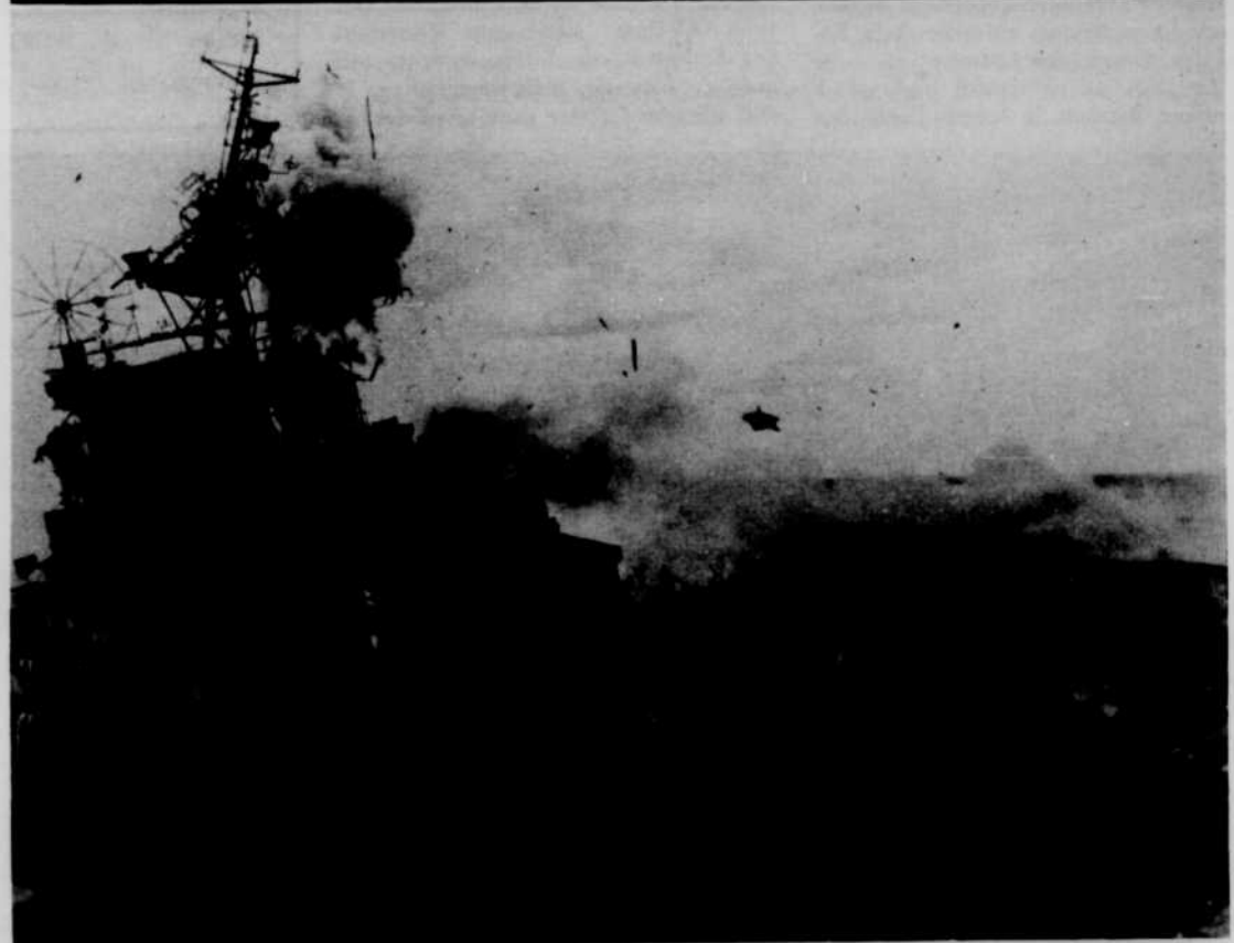
Un sous-marin remonte à la surface pour attaquer — un bombardier japonais vient d'atteindre un porte-avions, deux scènes du documentaire "Victory at Sea".