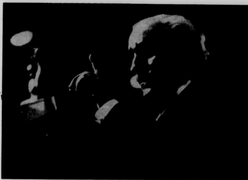
ARTURO TOSCANINI reprend la direction de l'orchestre de la NBC.

Ses apparitions londonniennes demeurent, selon la critique, les plus grands événements musicaux de la capitale anglaise depuis vingt ans. Les billets pour les concerts du maître italien avec l'Orchestre Philharmonia furent vendus complètement plusieurs semaines à l'avance.