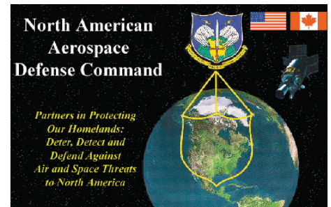
Blason de NORAD

Le développement de la technologie des missiles balistiques intercontinentaux dans les années 1960 et 1970 nécessita un élargissement du mandat initial du NORAD pour y inclure cette nouvelle menace. Puisque ces missiles se déplacent en partie dans l'espace au cours de leur trajectoire,