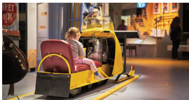
À la demande générale, l'exposition Coup de cœur! Nos collections s'exposent est prolongée jusqu'en janvier 2024.