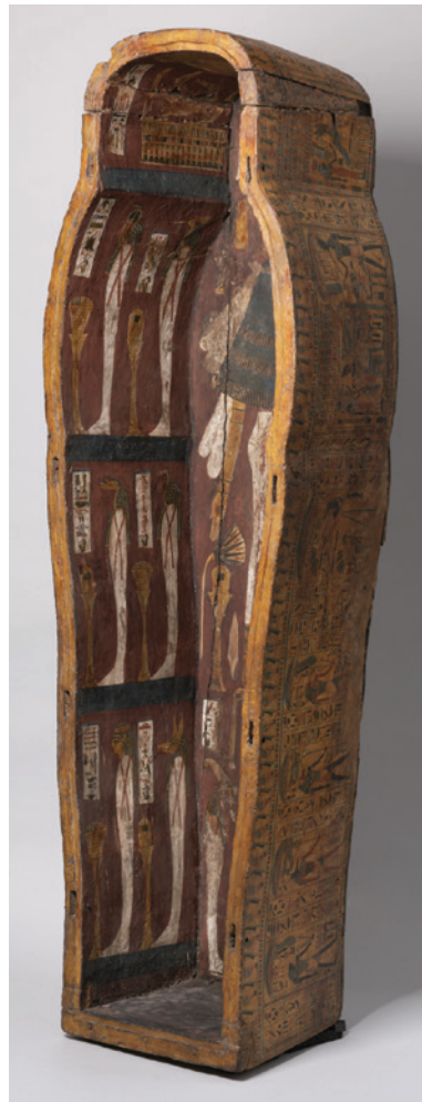
Coffre du cercueil de Nesi-Khonsu. Bois stucé peint. Début de la Troisième Période intermédiaire (1076-943 AEC).