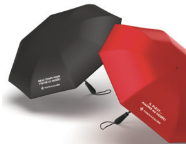
Les produits signés Pointe-à-Callière en vente à la Boutique du Musée.