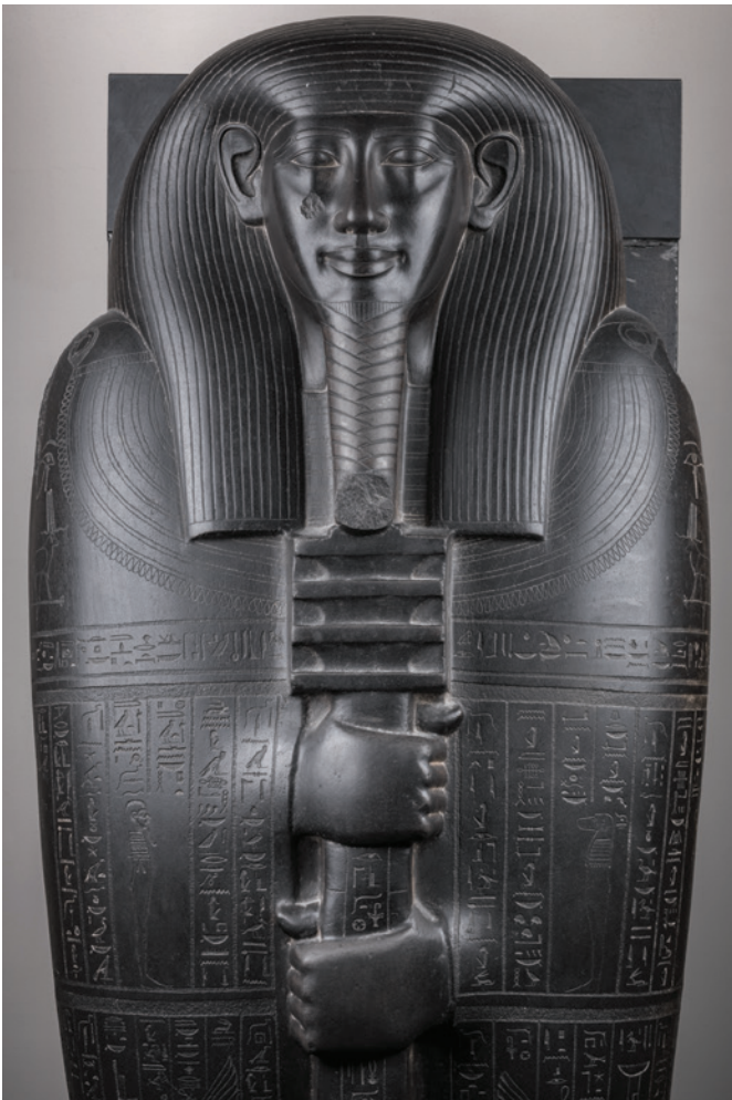
Couvercle du sarcophage d'Ibi. Pierre et grauwacke. Début de la Basse Époque (664-525 AEC).