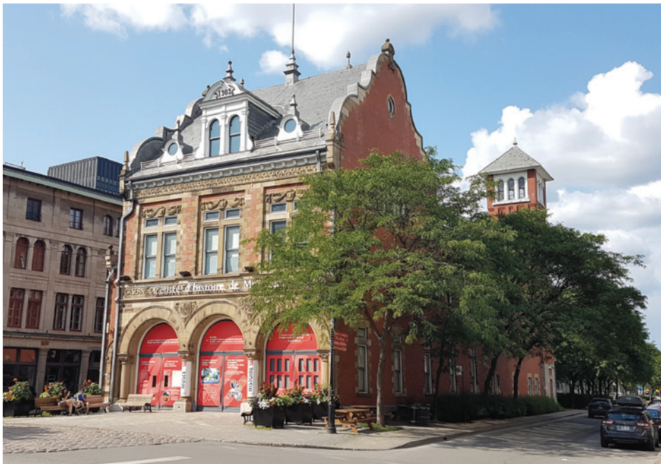
Bâtiment de la Caserne n° 1 des pompiers dans le Vieux-Montréal.