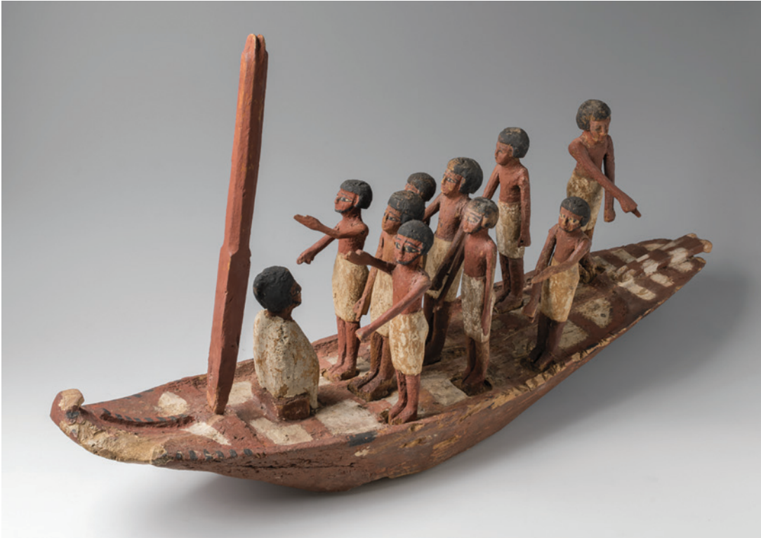
Des maquettes de bateaux ont été trouvées parmi le mobilier funéraire, symbolisant le voyage des défunts dans l'au-delà. Bois sculpté, stucé et peint. Première Période intermédiaire – Moyen Empire (2118-1700 AEC).