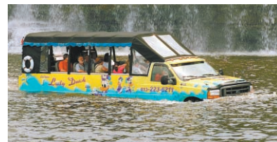
Le Lady Duck photographié l'an dernier.