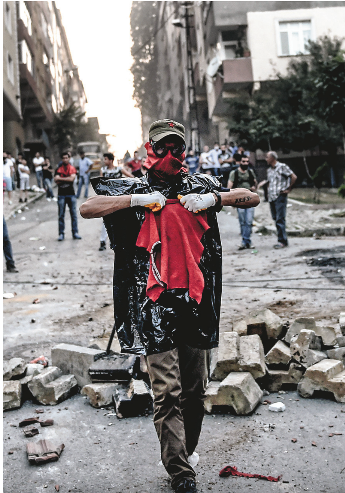
De violents affrontements ont opposé forces de l'ordre et manifestants d'extrême gauche à la suite de la nouvelle offensive contre le PKK. Un policier est mort.