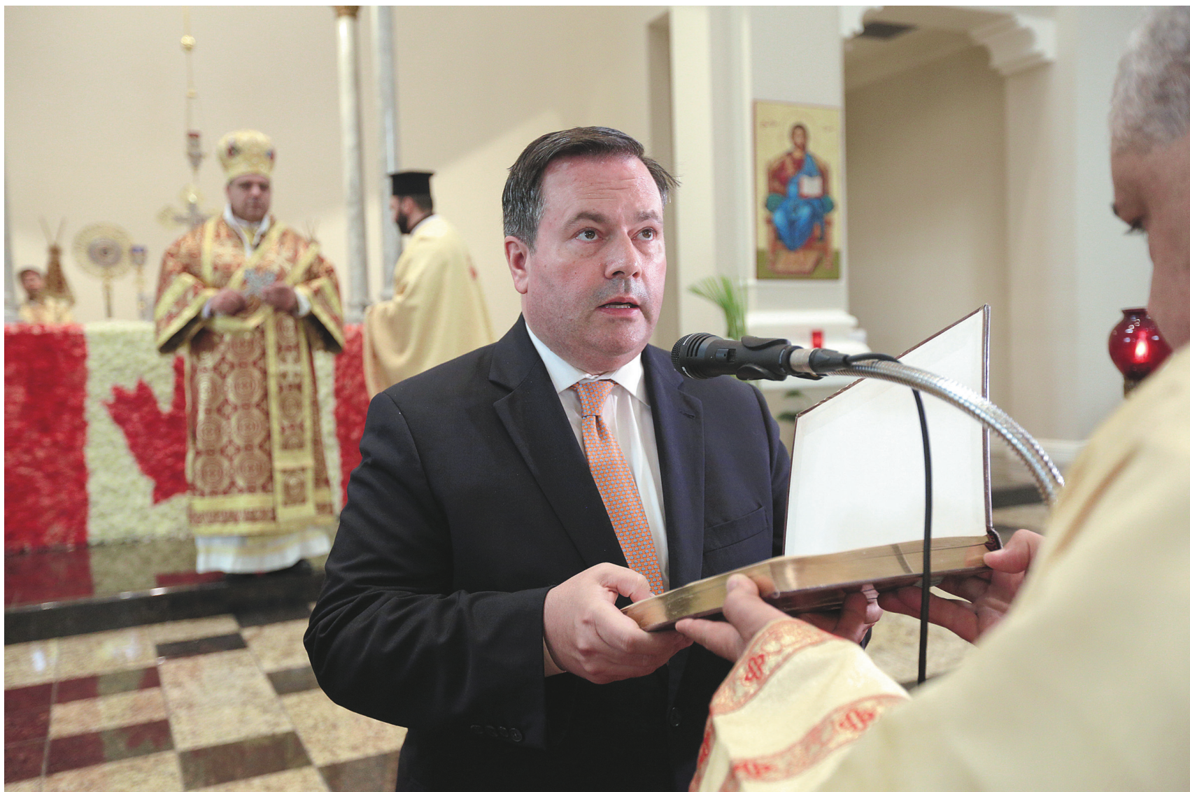
PEDRO RUIZ LE DEVOIR

Ottawa — Le Nouveau Parti démocratique (NPD) assure qu'il disposera de «toutes les ressources nécessaires» pour mener une campagne «rigoureuse» en vue des élections prévues à l'automne, malgré le portrait peu réjouissant de ses finances présenté dans Le Devoir , samedi. En vertu des règles d'Élections Canada, chaque candidat peut dépenser jusqu'à 100 000 $ lors des élections fédérales. Or, seulement 7 des 54 députés du NPD au Québec ont dans leurs coffres plus de 30 000 $. La moitié des associations de circonscriptions comptant des députés néodémocrates ont moins de 20 000 $, dont cinq qui ont moins de 10 000 $ d'économies. Les données du Directeur général des élections (DGE) remontent au 31 décembre dernier.