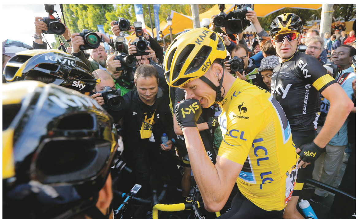
Chris Froome célébrait dimanche sa deuxième victoire en trois ans après une édition controversée.

Les données physiologiques de Chris Froome, notamment l'impressionnante puissance qu'il développe en poussant sur les pédales malgré ses jambes effroyablement maigres, auront alimenté les débats en permanence. Avant même la montagne, avec la révélation des données de son ascension ahurissante du mont Ventoux lors de son premier Tour victorieux en 2013. Plus encore à partir de sa prise de pouvoir au plateau de Beille, où l'affaire a pris des proportions absurdes. Un spécialiste interrogé par France Télévisions a dégagé