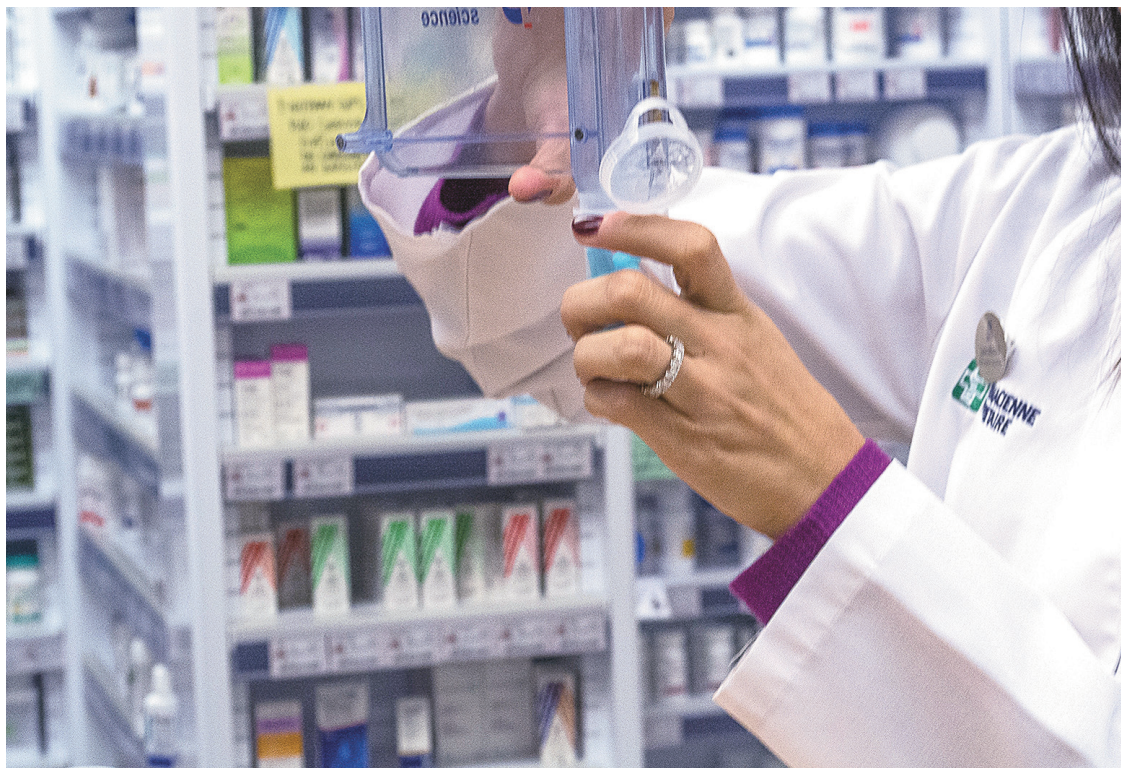
MICHAËL MONNIER LE DEVOIR