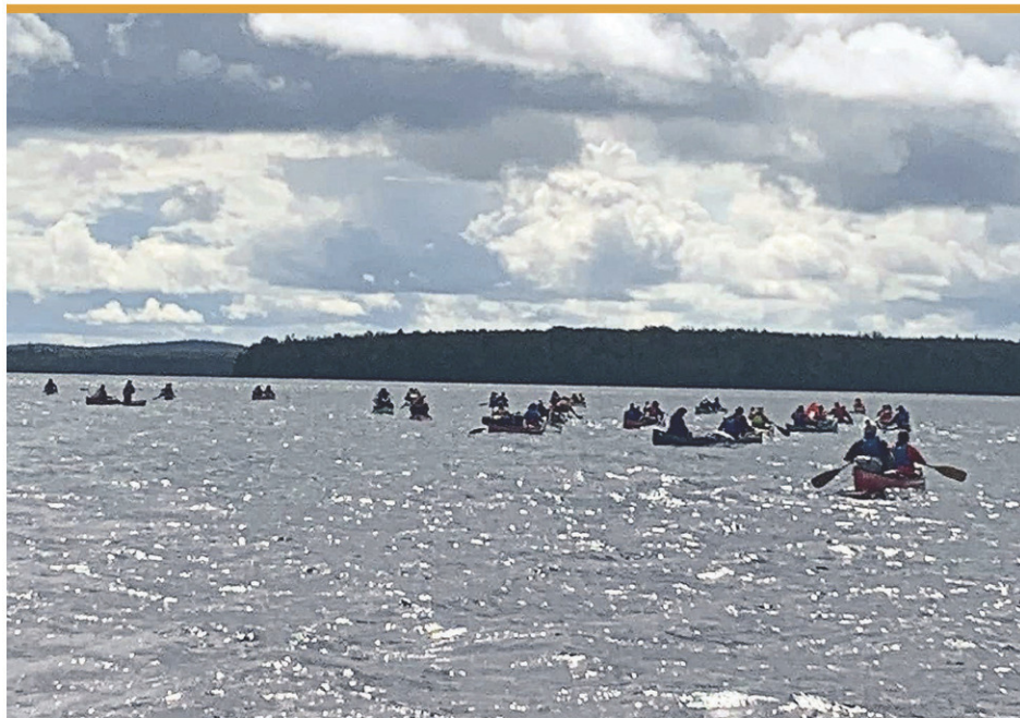
En plus des accompagnateurs, l'expédition a regroupé 54 participants.