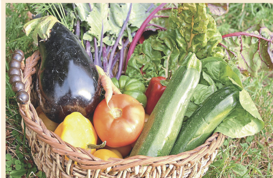
Panier de légumes

Toutes les activités sont gratuites. (M.S.)