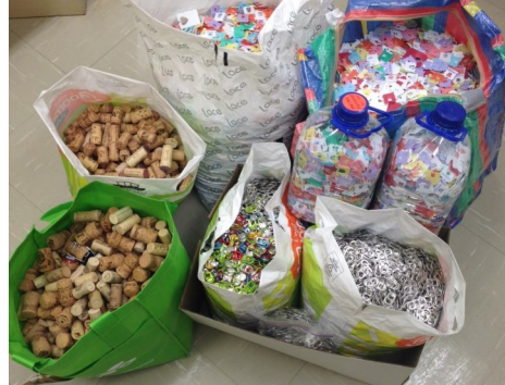
Une partie des attaches à pain, goupilles et bouchons de liège amassés dans le cadre du projet Solidarité