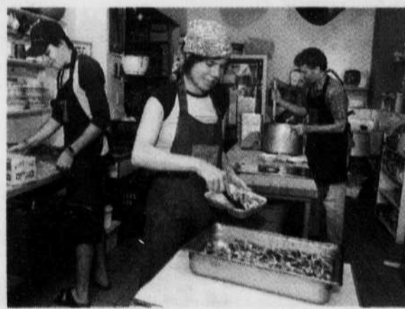
La popote intergénérationnelle du Santropol Roulant.