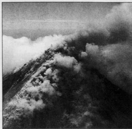
Dans Forces de la nature , les images, sur écran Imax, de l'explosion d'un volcan coupent le souffle aux spectateurs.

Les 25 secondes du tremblement de terre qui a détruit Izmit, en Turquie, en 1999, ont été fatales pour 25 000 personnes et en ont laissé 500 000 autres sur le pavé. Ces secondes mortelles sont aussi auscultées avec une minutie extrême par des chercheurs dont