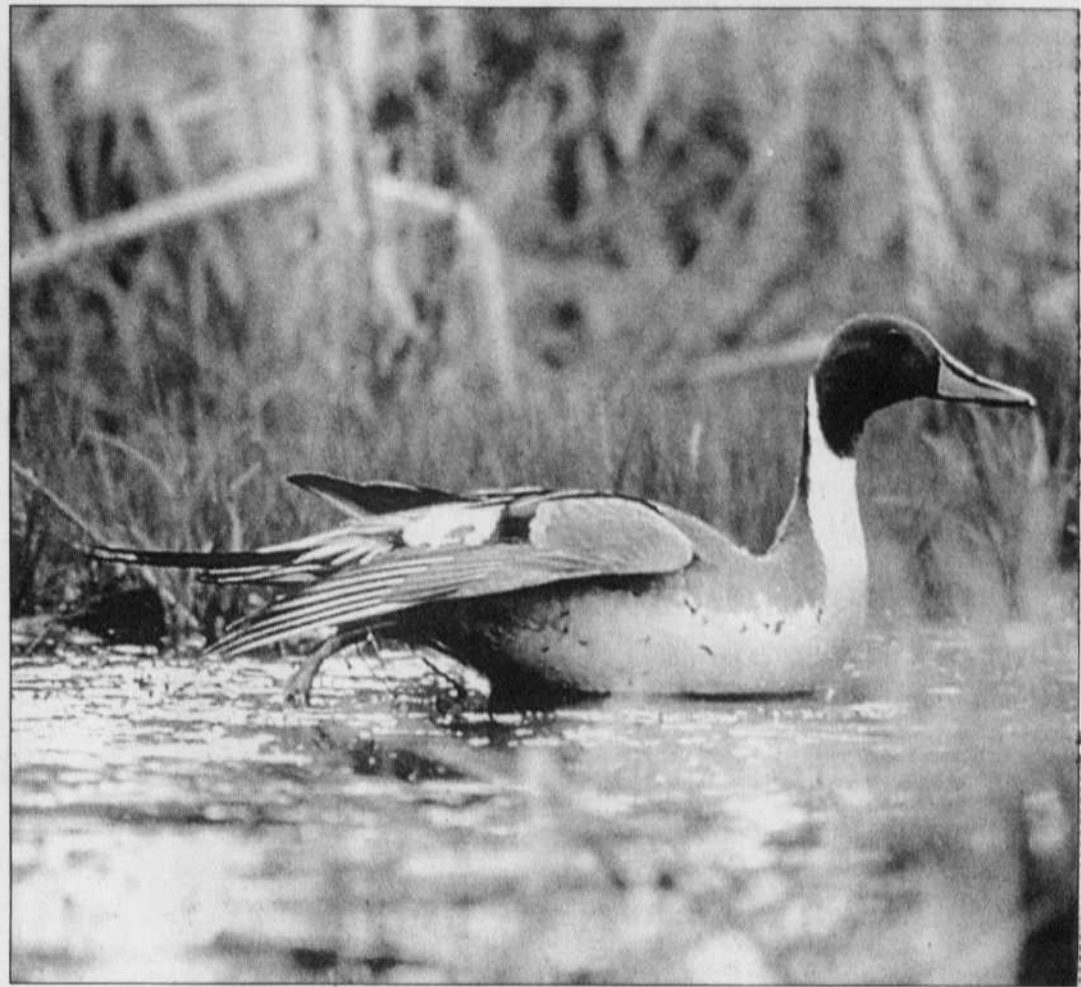
Un canard pilet se repose en attendant de reprendre sa migration.

Rivière milliardaire: la valeur économique des activités récréatives qui dépendent actuellement de la rivière Murray, en Australie, a été évaluée à un milliard de dollars, ce qui donne une faible idée de la valeur qu'aurait cette rivière si on lui redonnait santé et caractère naturel. Ce coût ne comprend pas non plus la valeur intrinsèque des espèces vivantes qu'elle abrite ni sa valeur comme capital biologique et génétique pour les générations futures. L'étude a été financée par l'Australian Conservation Foundation, qui fait campagne pour mettre fin aux dérèglements que subit ce cours d'eau. Cette rivière, qui coule sur plus de 2500 kilomètres dans le sud de l'Australie, est de plus en plus saline à cause de la construction de barrages, des ponctions par l'irrigation et des sécheresses. D'ici 2050, on estime qu'elle sera trop saline pour pouvoir en tirer de l'eau potable!