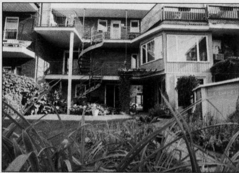
La cour a été transformée en un espace de calme pour les proprios et le voisinage, avec un effet d'entraînement auprès des résidents du quartier.

La visite se concentre ensuite sur les maisons historiques. Le guide se pro-