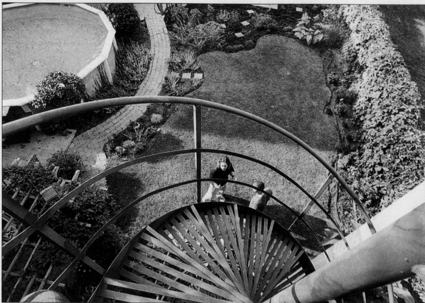
Lorsque le propriétaire actuel a fait l'acquisition de cette maison, rue Dufresne à Montréal, la cour servait de piquerie, de refuge pour les squatters et les prostitués et de litière pour les chiens et les chats errants du quartier...

Le Centre d'histoire de Montréal lance un premier projet d'auto-interprétation du patrimoine immobilier