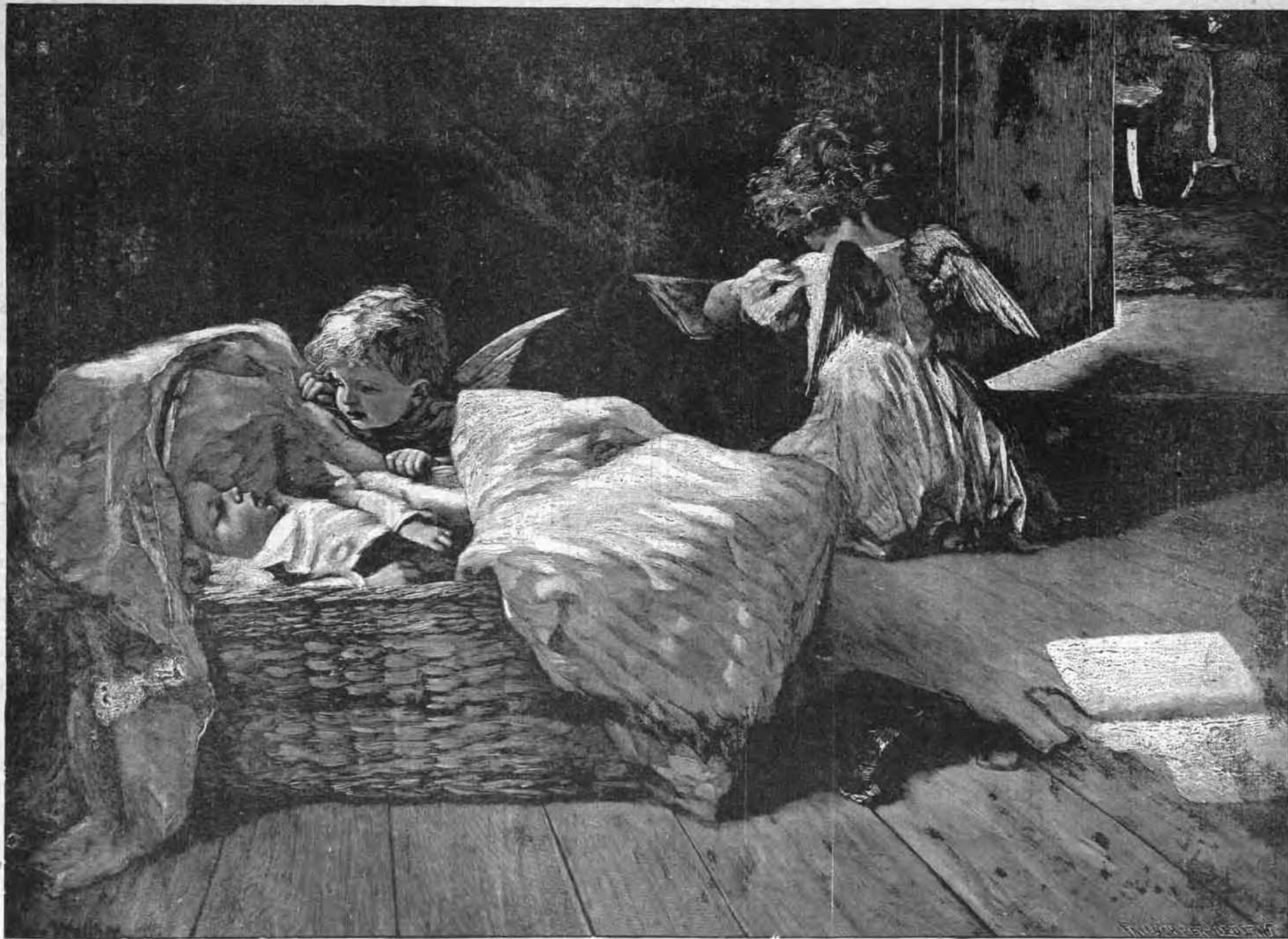
Les anges du ciel s'unissent aux anges de la terre