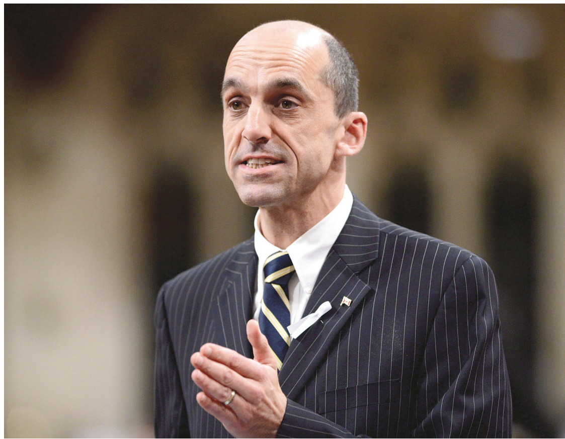
SEAN KILPATRICK LA PRESSE CANADIENNE

Aux États-Unis, de telles banques publiques ont permis à des citoyens de se faire justice eux-mêmes. Une étude de l'American Public Health Association a recensé le cas d'un homme ayant agressé sexuellement une adolescente qui a été décapité et brûlé par un groupe de jeunes au Michigan en 2007. La même année, une femme est morte au Tennessee dans l'incendie de sa maison allumé par deux voisins parce que son conjoint figurait dans un registre. En 2006, un homme de Nouvelle-Écosse s'est rendu aux