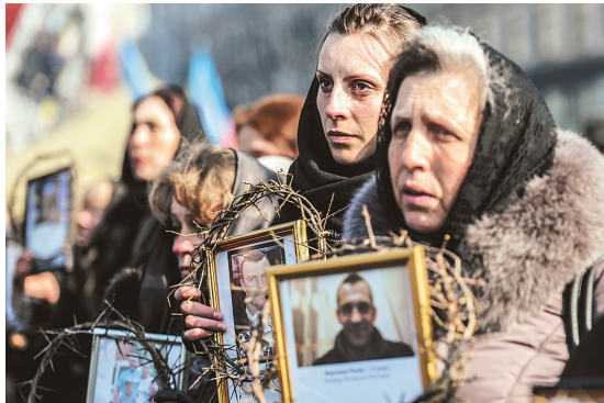
Kiev a été le théâtre mercredi d'une marche à la mémoire des manifestants décédés.