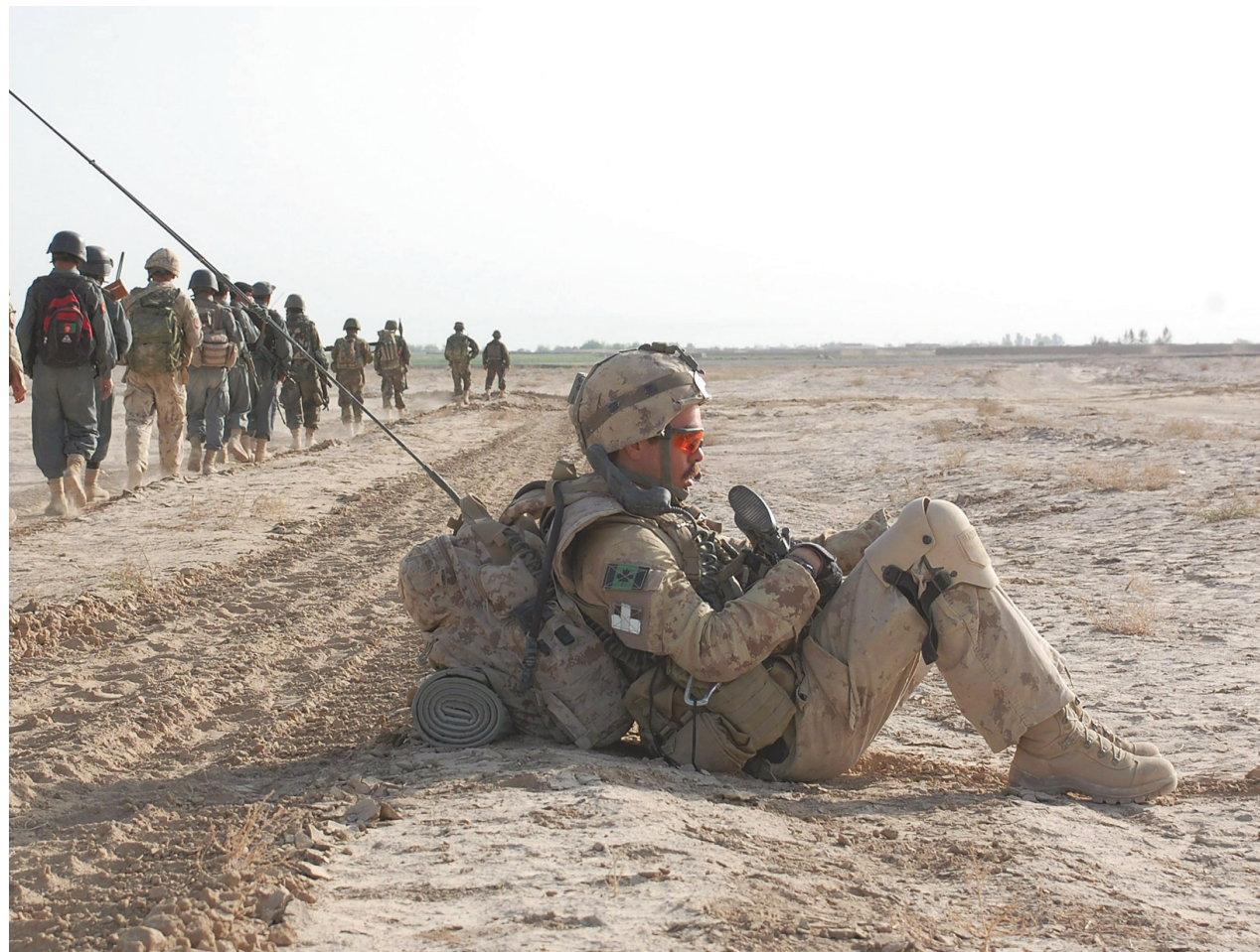
MURRAY BREWSTER LA PRESSE CANADIENNE

Le ministère des Anciens Combattants a à ce jour réussi à localiser 250 vétérans qui vivaient dans les rues. Plusieurs sont en choc post-traumatique, ou présentent des signes de dépression.