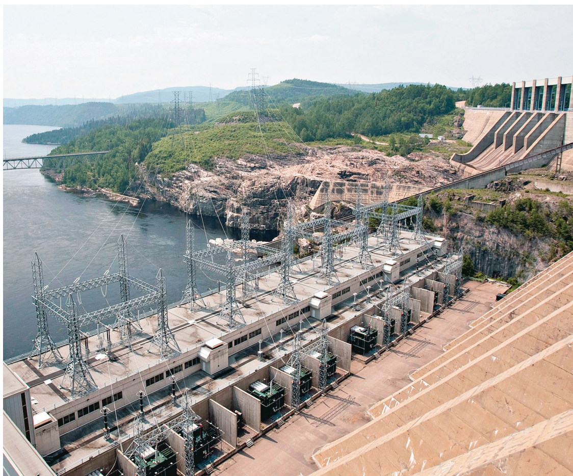
JACQUES BOISSINOT LA PRESSE CANADIENNE

Les surplus d'électricité ont pris une telle ampleur que le gouvernement a lancé une politique spéciale sur l'usage de ces surplus en octobre 2013. L'objectif de cette politique est d'attirer de nouvelles entreprises qui consomment 15 mégawatts (MW) ou plus en leur offrant un rabais tarifaire diminuant dans le temps, de sorte que les entreprises bénéficiaires paieront le tarif ordinaire après dix ans. Il s'agit d'une « vente à tout prix » alors que le marché de l'exportation n'est pas très attrayant en raison de la chute des prix causée par l'arrivée massive du gaz de schiste. Des secteurs spécifiques sont visés: la transformation des ressources naturelles, la fabrication de composantes liées aux énergies renouvelables et aux technologies vertes, la fabrication de composantes liées à l'électrification des transports, les centres de données et les tech-