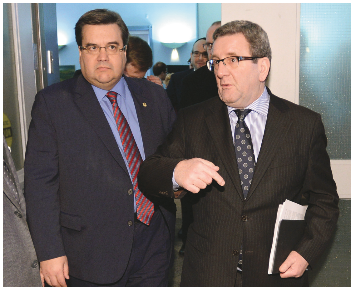
Denis Coderre et Régis Labeaume ont assisté au caucus des maires des principales villes canadiennes mercredi à Toronto, en évitant soigneusement le maire Rob Ford.