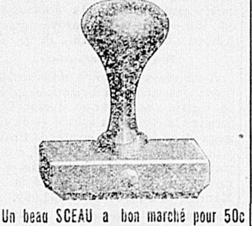
Un beau SCEAU à bon marché pour 50c