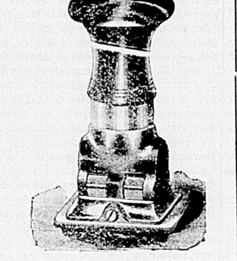
Complet pour $1.50.

T. J. Moore & Cie, 146-148, RUE ST-JEAN, QUÉBEC. 15 mai 1894—1m.