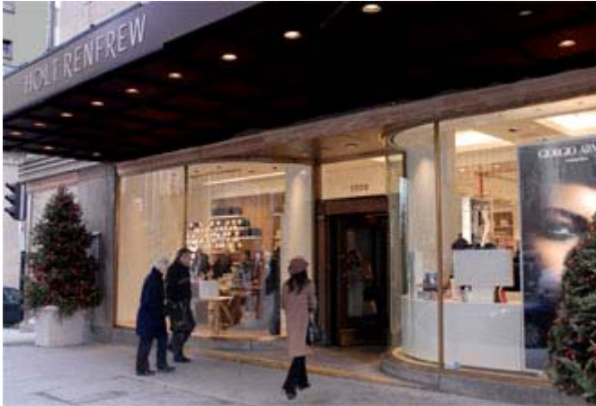
Magasin Holt Renfrew Montréal