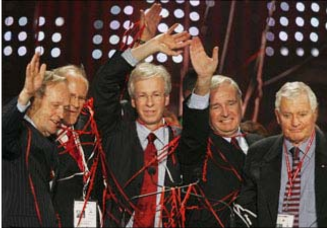
Stéphane Dion (au centre) et trois ex-Premiers ministres du Canada

Le nouveau chef du Parti libéral du Canada, Stéphane Dion n'était pas le favori au départ mais il a déjoué ses adversaires dans la campagne à la direction de son parti. Sa personnalité intellectuelle et son style universitaire font de lui un excellent choix pour affronter l'actuel Premier ministre du Canada, Stephen Harper, lui aussi considéré comme un intellectuel. Les deux hommes se ressemblent aussi au niveau de leur image publique, alors qu'aucun n'est très charismatique. Notons que Dion obtient 35% de la faveur des Québécois selon un récent sondage contre 17% pour Harper. Également, Stéphane Dion est un homme du monde car il détient une double citoyenneté, canadienne et française... (Voir éditorial de l'éditeur) www.LeStudio1.com/Editeur