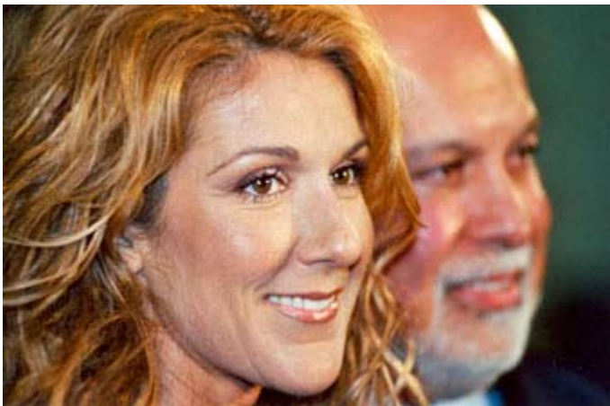
Céline Dion et René Angélil

Céline Dion et René Angélil ont fait la manchette récemment concernant le manque de respect à leur égard de la part de certains journalistes du Québec. Leur cas