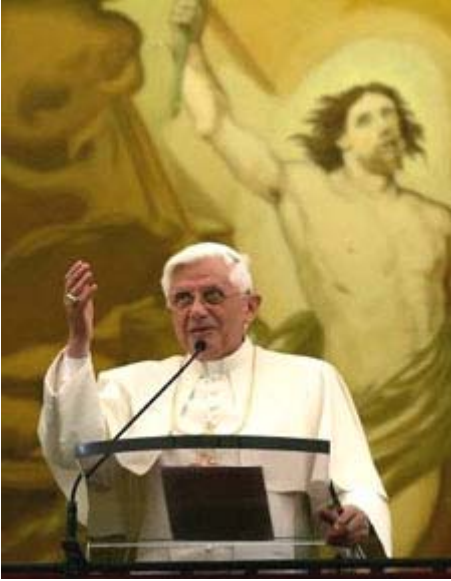
Le pape Benoît XVI

Le pape Benoît XVI est un auteur prolifique et il a publié jusqu'à maintenant un total de 27 livres. Benoît XVI publiera un autre titre au début de 2007 dont le sujet sera la vie de Jésus allant de son baptême jusqu'à la transfiguration. La préface de ce livre risque de susciter un débat car Benoît XVI écrit que les lecteurs sont libres d'être en accord ou non avec ses écrits. Cela vient contredire le principe de l'infaillibilité du Pape. Le nouveau livre sur Jésus fait le rapprochement entre le personnage historique et celui de la foi catholique. À la fin, les deux Jésus viennent se confondre en une même personne. Le livre est attendu en mars 2007.