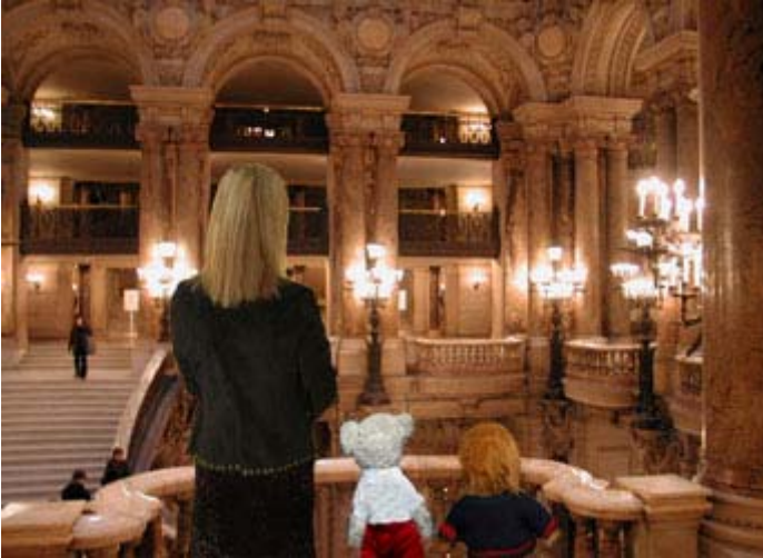
mademoiselle X et les deux mascottes, Miss Gym et son frère Monsieur X, à l'Opéra Garnier de Paris.

«La vie ne vaut rien. Mais rien ne vaut la vie.» -André Malraux