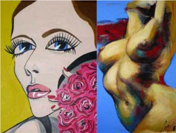
Toiles par Elisabetta Fantone et Corno

Les galeries d'art sont de plus en plus nombreuses au Québec. Le marché de l'art visuel se divise en deux classes: celle des oeuvres nouvellement créées et l'autre des oeuvres de collectionneurs. Le secteur des oeuvres de collection est le plus rentable et les pièces peuvent parfois atteindre des prix très élevés lors des encans. Pour ce qui est des oeuvres nouvelles, le marché est plus populaire et les prix beaucoup moins élevés. Mentionnons deux expositions qui sont à l'affiche à Montréal: Corno qui a inauguré sa galerie exclusive Axa située au 2142 rue Crescent; et celle d'une nouvelle artiste, Elisabetta Fantone, à la galerie Pangée de la rue St-Paul.