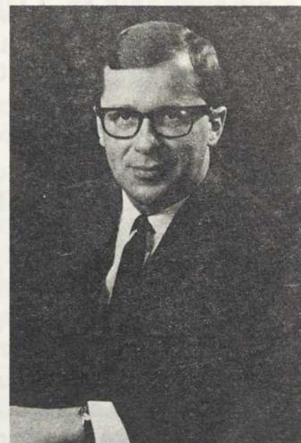
L'HONORABLE GÉRARD-D. LÉVESQUE