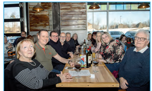
L'activité de financement a rassemblé pas moins de 200 convives. Tous ont été ravis de participer au souper, à l'encaen ainsi qu'aux nombreux tirages.