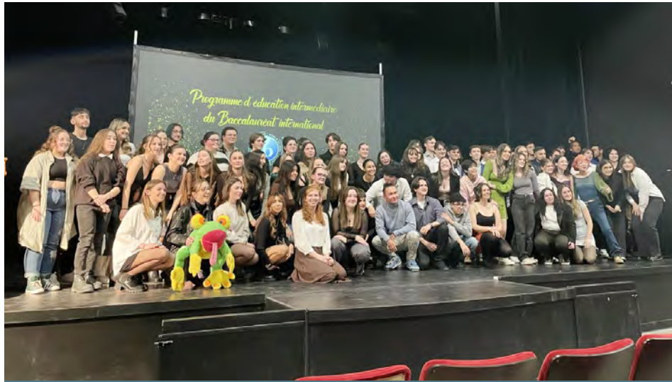
Les finissants de la cohorte 2022 du Programme d'éducation intermédiaire du baccalauréat international de la polyvalente Deux-Montagnes.

Le 16 janvier s'est tenue la 20e édition de la Remise des diplômes du Programme d'éducation intermédiaire du baccalauréat international (PEI) de la polyvalente Deux-Montagnes (PDM).