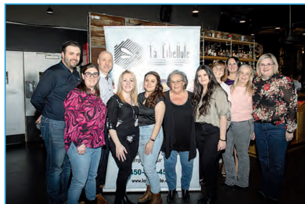
Le conseil d'administration et une partie de l'équipe de La Libellule.