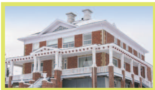
2950, 19 e Avenue, St-Prosper