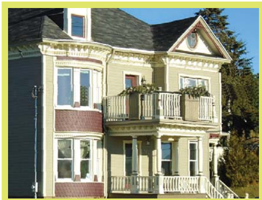
158, rue Principale, Sainte-Justine