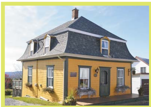
124, rue Principale, St-Magloire