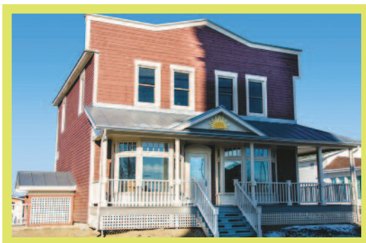
611, rue Principale, Saint-Camille