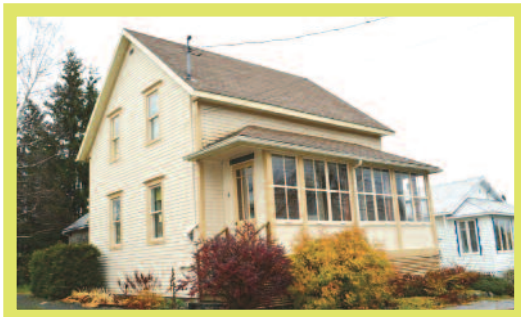
9, rue de la Fabrique, St-Camille