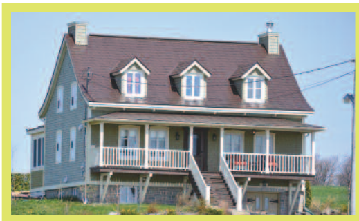
570, route 204, Sainte-Justine

L'architecture est définie par plusieurs styles dont certaines caractéristiques permettent de les reconnaître plus facilement. En voici quelques-unes pour les principaux styles que l'on retrouve sur le territoire: