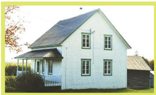
220, 5 e Rang, Ste-Rose