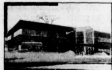
• Édifice Moreau, Sainte-Foy

En matière de gestion immobilière, il vaut mieux faire affaire avec des professionnels.