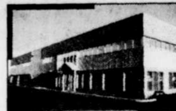
• Édifice le Maricourt, Sainte-Foy