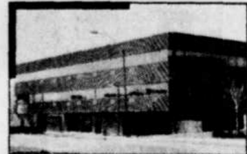
• Édifice de la Parade, Sainte-Foy