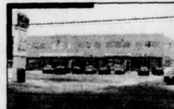
• Société Plaza Hamel, Québec