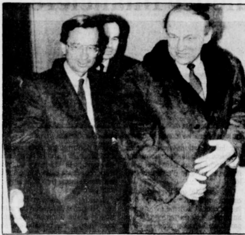
Les premiers ministres Bourassa et Calfa

La délégation tchécoslovaque a d'ailleurs visité hier matin la papeterie Kruger à Trois-Rivières. Impressionné par les « installations