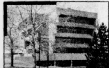
• Édifice Jean Durand, Sainte-Foy