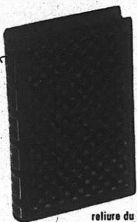
reliure du XIXe siècle LE PÈRE GORIOT d'Honoré de Balzac