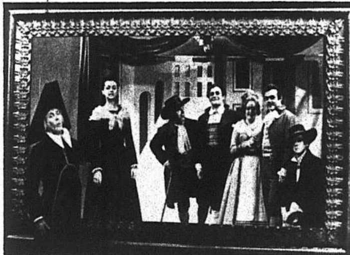
Une scène de l'inoubliable "Barbier de Séville" de la chaîne française, repris par la chaîne anglaise.

Ainsi, il y a des problèmes de studio qui seraient aigus dans le cas d'une production dramatique d'une heure ou d'une heure et demie tournée en anglais et en français dans les mêmes décors. Les stu-