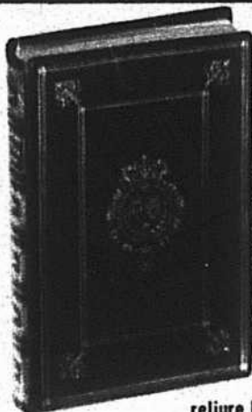
reliure Louis XIV LES FABLES de la Fontaine