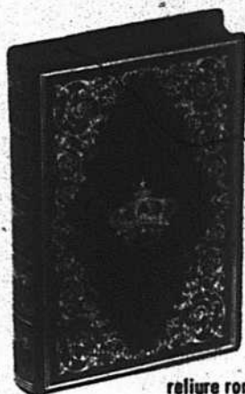
reliure romantique LE ROUGE ET LE NOIR de Stendhal