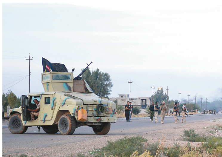
Les forces irakiennes surveillaient une route au cours d'une opération contre l'EI au nord-est de Bagdad, dimanche.