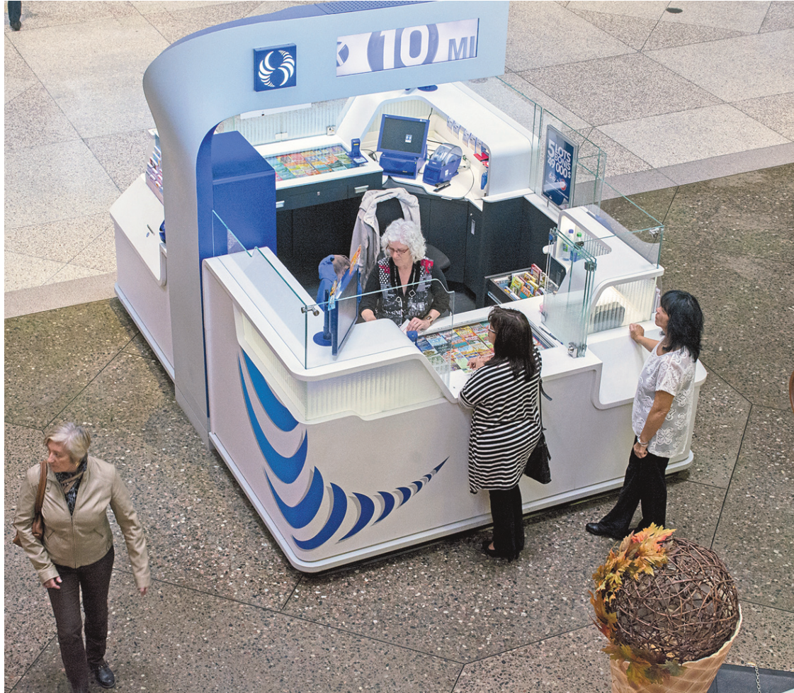
MICHAËL MONNIER LE DEVOIR

À d'autres égards, Atlantic City peut aussi inquiéter les États voisins, en particulier le Québec. Cette ville de mer, de villégiature et de jeu était plei-