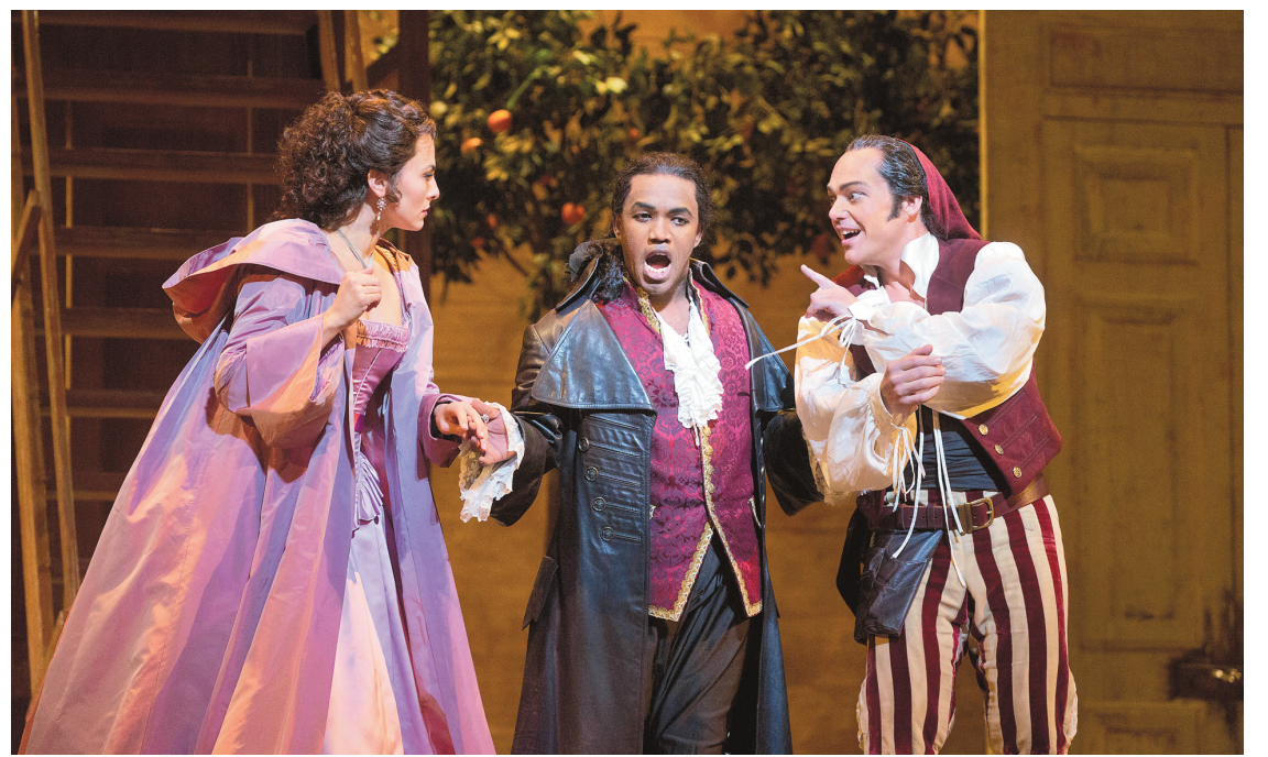
KEN HOWARD METROPOLITAN OPERA

Le réalisateur est tombé comme un bleu dans le piège de cet opéra: le filmage des ensembles. Combien de fois l'a-t-on vu faire balayer la scène par les caméras en travelling latéral — parfois en aller-retour! — comme un sniper cherchant une cible ou un gamin testant son caméscope à une fête de famille? Nous sommes assurément arrivés à un degré d'alerte pour cette institution phare qui, au lieu d'engager en Europe des experts aguerris du filmage