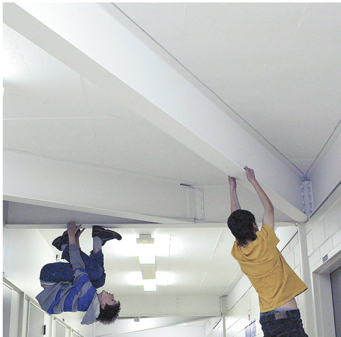
La marche à suivre, de Jean-François Caissy, a reçu une mention spéciale aux RIDM.