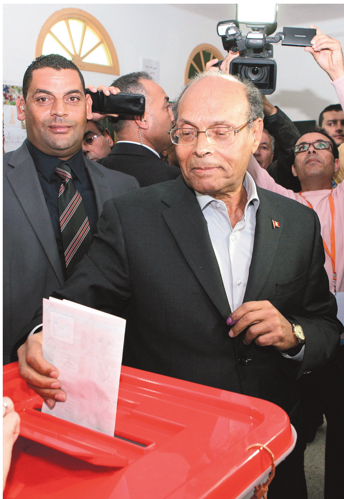
Dimanche, l'actuel président et candidat à la présidence Moncef Marzouki déposait son bulletin de vote, lors du premier tour de la première élection présidentielle libre en Tunisie depuis la chute du dictateur Zine El Abidine Ben Ali, en 2011.