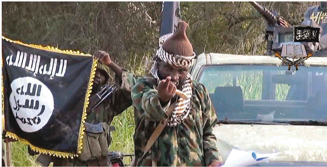
Une image tirée d'une vidéo diffusée par Boko Haram montrant son chef, Abubakar Shekau.

Selon lui, les insurgés ont arrêté sur la route le convoi des commerçants, au niveau de la localité de Dogon Fili, à 15 km de Doron Baga, massacrant sur place une partie