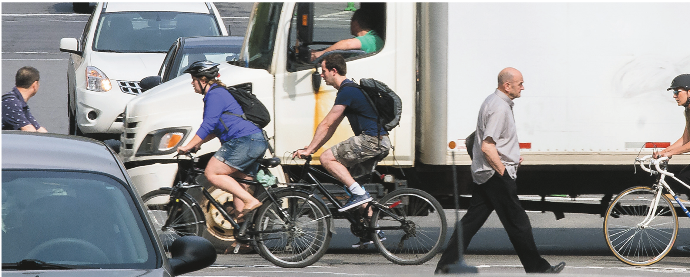
MICHAËL MONNIER LE DEVOIR

Chaque semaine, 227 000 camions se déplacent sur les routes du Québec. À Montréal, plus de 62 000 poids lourds traversent la métropole de façon hebdomadaire, selon une enquête publiée par le ministère des Transports l'an dernier. Au cours des cinq dernières années, plus de 1000 collisions impliquant un poids lourd ont eu lieu.