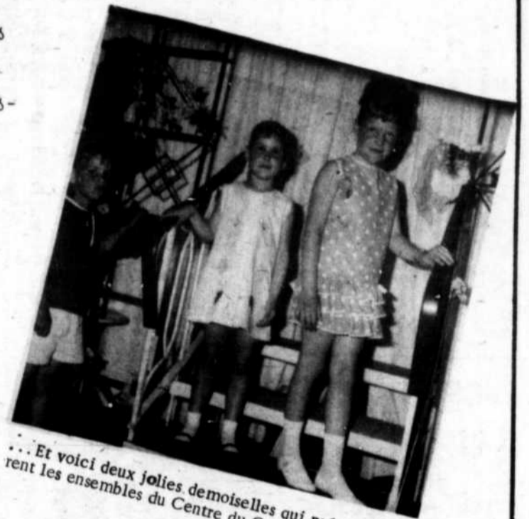
... Et voici deux jolies demoiselles qui présentent les ensembles du Centre du Coupon.