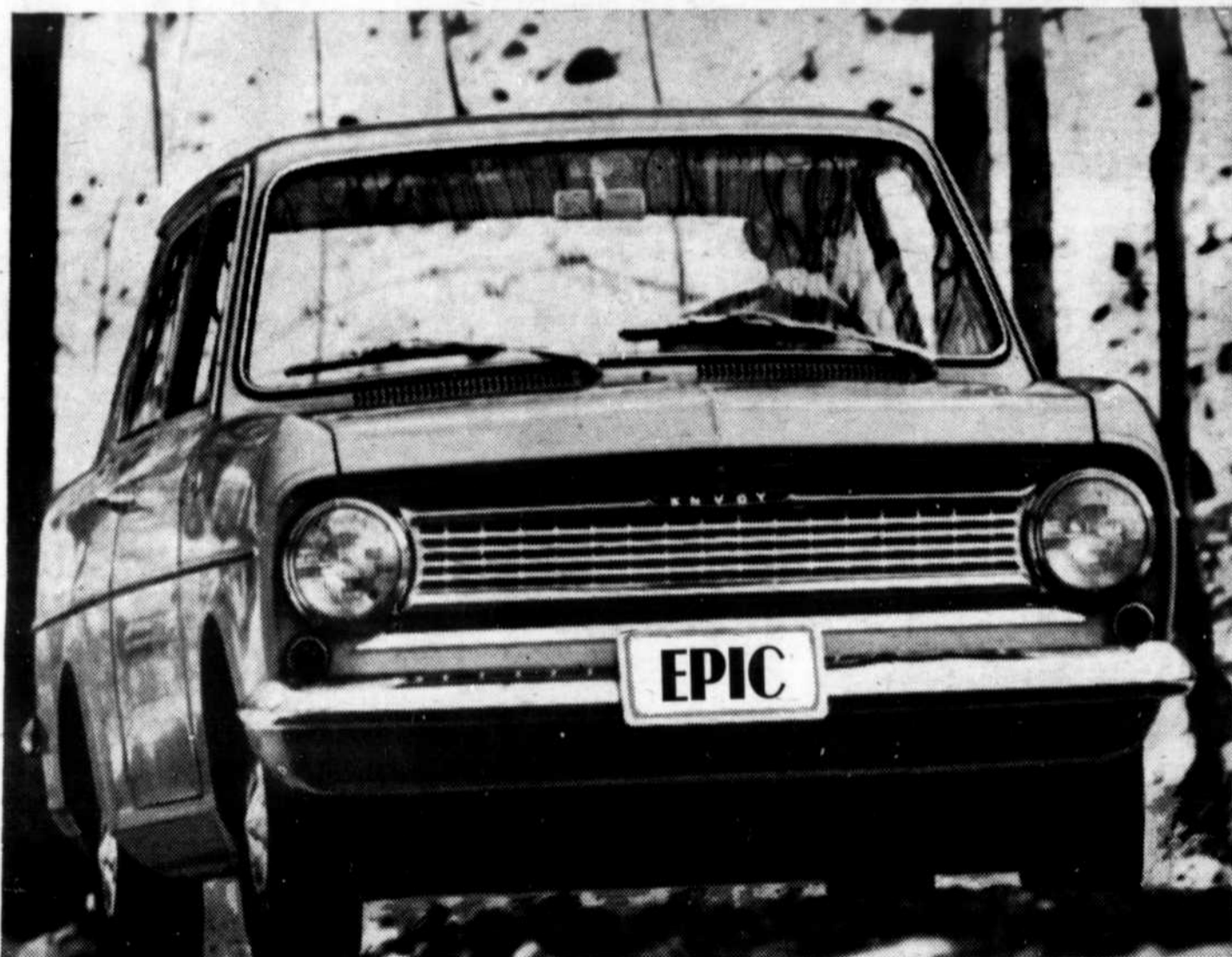
Le sedan 2 portes Epic de luxe

L'Epic: beaucoup de qualités. Beaucoup d'agrément pour beaucoup de gens. Vous recevrez beaucoup chez le concessionnaire Chevrolet-Epic, pour $1,770.00* seulement.