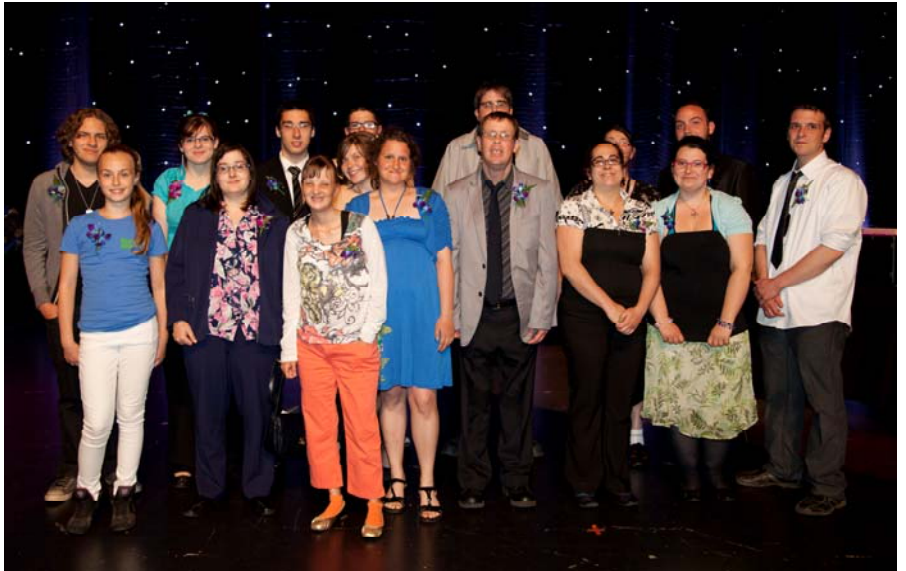
Les lauréats de l'édition 2013 du Gala Florilège

Le Forum jeunesse est fier d'être l'instigateur de ce seul événement de reconnaissance des jeunes de Lanaudière.