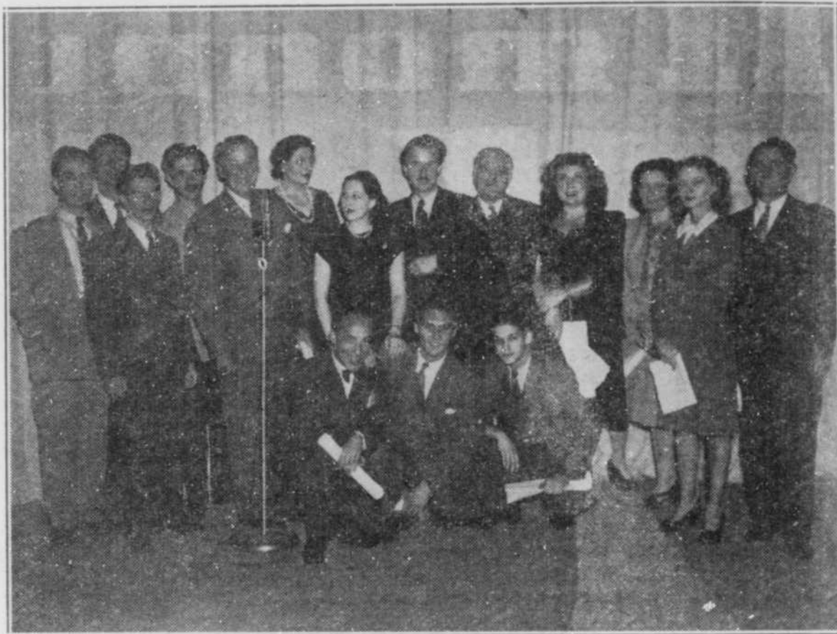
Quelques-uns des plus grands noms de radio canadienne-française prenaient part à la Première automne 1945 du Théâtre de Radio-Canada, diffusé les jeudis soirs de 9 heures à dix. Les lecteurs les identifieront tous sans aucune peine.

N'oubliez donc pas d'écouter Mgr Maurault à 10 h. 15 du soir, le dimanche, 23 septembre prochain.