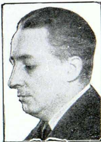
M. Marcel Dupré

Au cours de cette saison musicale, Marcel Dupré donna au Conservatoire de Bruxelles un concert d'un inté-