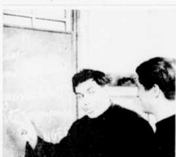
"Les Nouveaux Aristocrates", qui devaient passer mercredi dernier, ont été reportés au mercredi 26 janvier, au "Cinéma de Paris".

"Mon froussard favori". Un ancien collègue de Ness, devenu promoteur de boxe véreux, vit sous la coupe du puissant Johnny Fortunato.