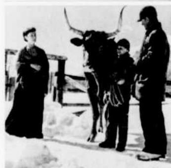
Deuxième épisode de "Sancho, le taureau voyageur", à "Walt Disney présente", cette semaine.

10.00—Conférence de presse 10.30—Le Professeur Guillemin "Les Dossiers de l'histoire : la tragédie de juin 1848" (2e partie). 11.00—Téléjournal 11.10—CBOFT—Dernière édition 11.15—Sports-dimanche 11.30—D'hier à demain "Visa pour l'avenir : la plus vieille ville du monde". Documentaire sur Ouarka, en Irak.