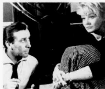
"Train de nuit"

11.00—Téléjournal 11.20—Supplément régional CBOFT—Dernière édition 11.25—Nouvelles du sport 11.30—Festival du cinéma polonais contemporain "Train de nuit", étude psychologique de Jerzy Kawalerowicz. En Pologne, parmi la foule des passagers d'un train de nuit, un homme et une femme font connaissance.