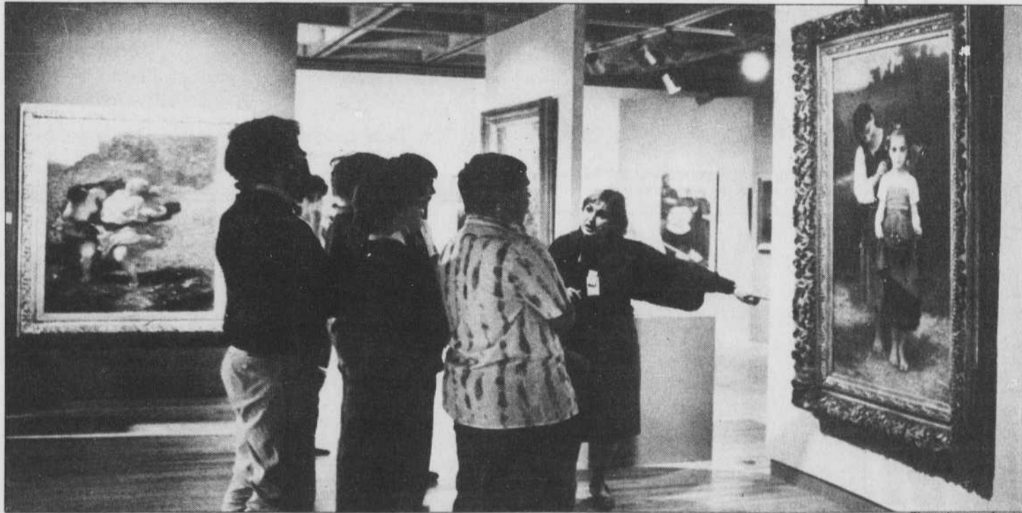
Les collections de nos musées sont souvent beaucoup plus riches que nous le croyons, mais en moyenne, 3% seulement des œuvres qu'elles contiennent sont présentées au public visiteur. Dans les grands musées européens et américains, la proportion atteint plus souvent près de 20%.

Le Musée du Québec compte dans ses collections plus de 10,000 pièces dont 95 % sont d'art québécois (peinture : 2,500 tableaux, sculpture : 1,200, œuvres sur papier : 6,000, orfèvrerie : 1,400). À l'exception de l'automne 84 où l'on célébrait le 50e anniversaire du Musée — 500 œuvres parmi les meilleures des collections permanentes furent présentées, on ne peut voir actuellement que 1 % de ces collections. Faut-il d'installations adéquates et d'espace, les œuvres sur papier dorment dans des tiroirs, sans parler de la donation Duplessis où l'on retrouve, entre autres, Turner, Boudin, Corot, Krieghoff et qui n'a jamais pu être vue en totalité. Par contre, une initiative récente telle la fondation d'une banque de prêts d'œuvres d'art grâce à laquelle le musée acquiert chaque