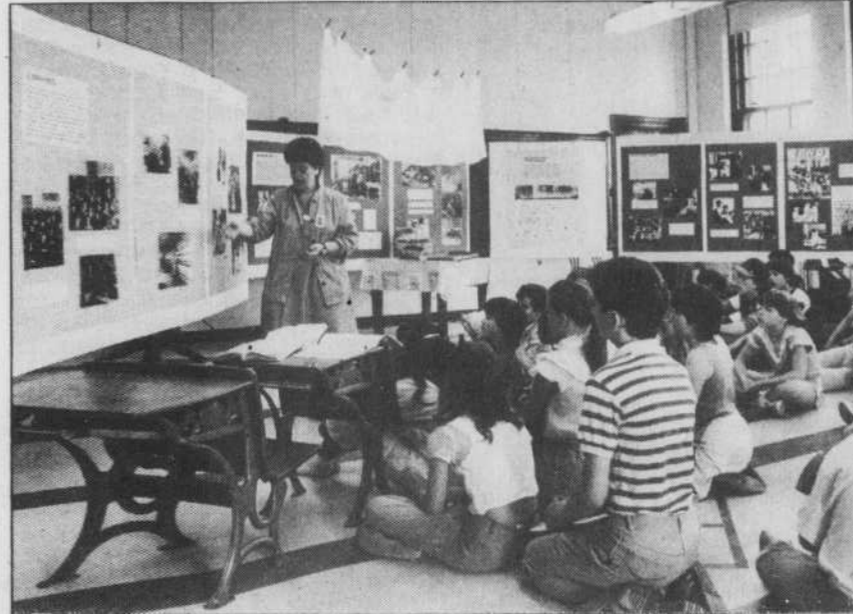
Dans une ancienne école de l'Est de Montréal, l'écomusée La Maison du fier monde, une nouvelle forme d'intervention muséologique accorde une attention toute spéciale aux groupes d'écoliers.

Le MBA se sent prêt à jouer dans les ligues majeures cette année et à faire concurrence aux plus grands musées nord-américains. «Tout ça est fort emballant», d'ajouter le directeur des communications. «Les Montréalais nous ont prouvé sans se laisser prier, en devenant spontanément «Amis» du musée cette année, qu'ils approuvent nos projets et sont fiers de participer au nouvel es-