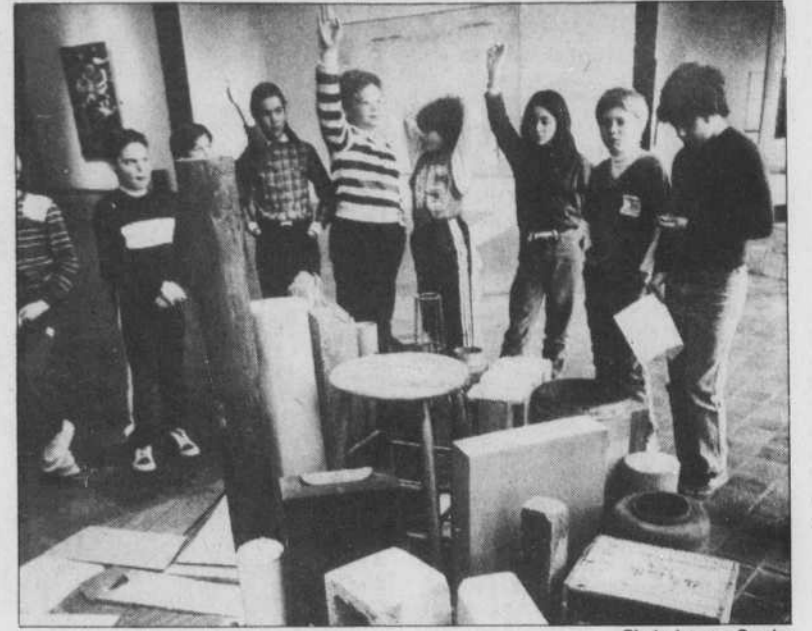
La plupart des musées tablent sur la relève écolière pour créer des habitudes de fréquentation.

Le Musée McCord qui appartient à l'Université McGill cherche encore la formule magique qui lui permettra, avec un budget de $750,000, de rendre encore plus accessible au public aussi bien francophone qu'anglo-