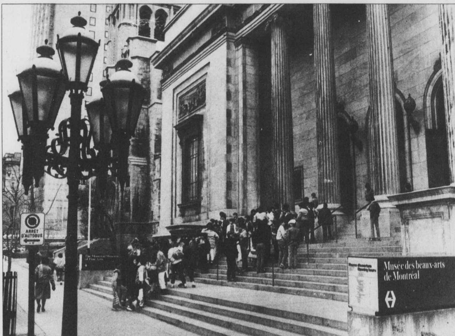
Le nombre de «membres» du Musée des beaux-arts de Montréal augmente constamment, mais l'indice général de fréquentation des musées au Québec, reste faible, notamment chez les francophones.

Il semble de plus que les francophones conservent leur réserve à l'égard des musées. Dans une enquête réalisée en juin 1984 auprès des visiteurs du Musée des beaux-arts de Montréal, François Colbert et Jacques Boisvert, des HEC, observaient que seulement 39,8 % des visiteurs de l'exposition Largillière étaient francophones, proportion bien inférieure à celle de leur représentation dans les populations montréalaise et québécoise. L'importance exceptionnelle du nombre des visiteurs de l'extérieur (55 %) n'explique que partiellement le phénomène. Peut-être devrait-on y voir un phénomène de société et de culture. En cela, le comportement des Québécois se rapprocherait de celui de leurs cousins français qui, malgré leur longue tradition culturelle et la richesse de leur patrimoine, ne sont pas non plus des fidèles de leurs musées. Un sondage de 1981-82 révélait que seulement 30 % des Français avaient visité un musée au moins une fois au cours des 12 derniers mois. On est loin de la situation qui prévaut aux États-Unis où 60 % des citoyens visitent au moins un musée d'art par année.