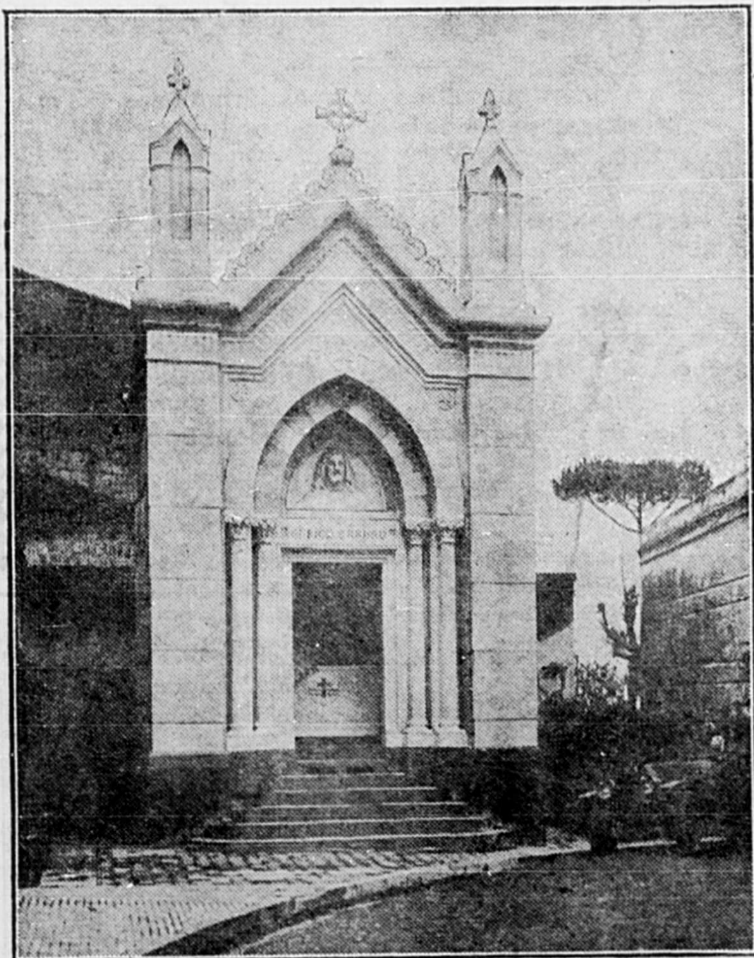
Le tombeau de Caruso à Naples

s'ébattre sur les plages toutes baignées de soleil de Nice, de Cannes ou de Saint-Raphaël et se plonger dans l'onde limpide de la Méditerranée. Nice fut cependant l'endroit qui parut plaire au plus grand nombre des visiteurs. Avec sa plage superbe, sa Promenade des Anglais, ses luxueux hôtels, dont les blanches façades se mirent dans les flots bleus de la mer, avec les monts abrupts aux flancs desquels elle s'agrippe, Nice est la reine véritable de la Riviera et l'on comprend sans peine, lorsqu'on y a séjourné, la raison de son universelle renommée.