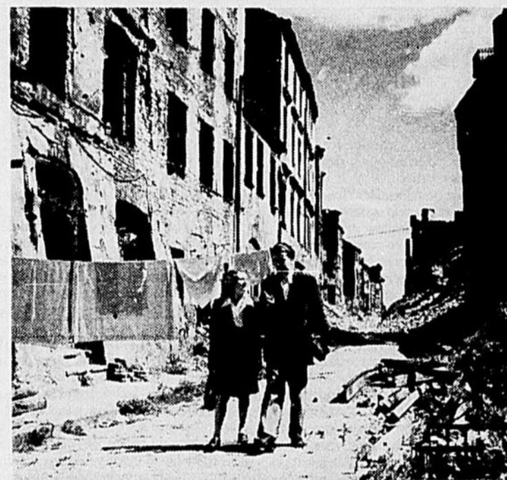
En route vers l'Université à Varsovie

L'Université de Montréal, depuis quelques années en particulier, a accru son influence dans le milieu universitaire canadien et même européen. Les étudiants de notre université participent maintenant aux principaux congrès et portent au loin la bonne renommée de l'U. de M. Il faut nous en réjouir.