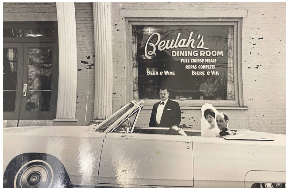
La fameuse salle à dîner de l'hôtel Maurice, connue sous le nom de Beulah's Dining Room.

« Notre entreprise servait une vingtaine de buffets de nocés et une quarantaine de