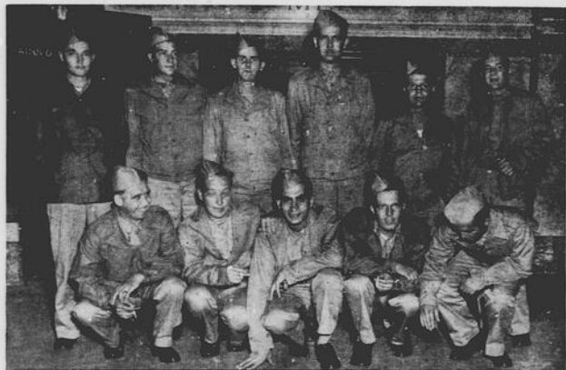
GRATEFUL FOR UNCLE SAM'S HOSPITALITY — These eleven Winnipeg Grenadiers who arrived in Vancouver late Friday evening were full of praise for the treatment accorded them by the U.S. Army since they were liberated from Jap prison camps. The men were given a varied assortment of American uniforms, flown across the Pacific to San Francisco, and given a royal reception in the States. Before continuing their journey home they will be outfitted in Canadian barracks at the Little Mountain Army Depot in Vancouver.

Replying to a merchant seaman, "Liberty" gave this vital information: "Merchant seamen, who received commercial rates of wages throughout the war, retained civilian status