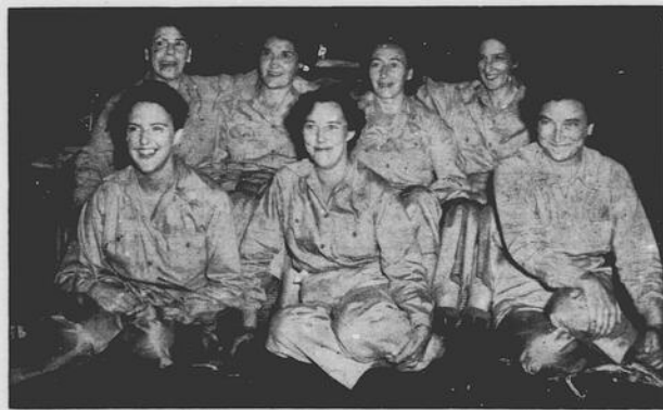
SORRIDENTI — Sette felici infermiere inglesi, prime ad essere liberate dal campo di prigionie giapponese, mostrano quanto sono felici di essere sul suolo canadese. Tutte e sette furono catturate a Hong Kong nel Natale del 1941, dove servivano come parte del "Queen Alexandra Nursing Service". Sono vestite temporaneamente con pantaloni, camicie e scarponi dell'armata americana.

E' ovvio aggiungere che l'industria britannica delle conserve in scatola ha approfittato di tutta