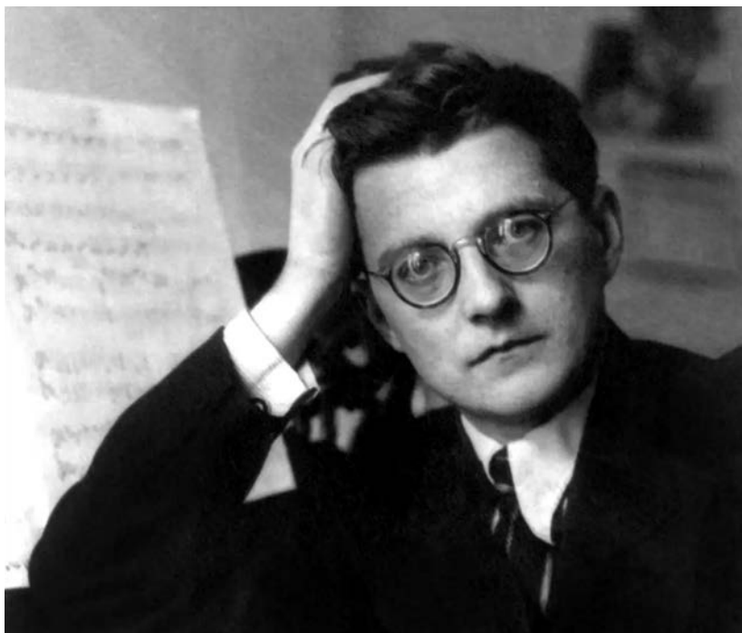
Dmitri Chostakovitch (autour de 1940)

The first movement alone takes up almost half the time needed to perform the entire work. Fate strikes from the very first notes in the lower register of the strings, a motif made up of dotted eighth notes. The breadth of intervals in the upper registers is worthy of the tragic circumstances surrounding the work's composition. In a second section, a more lyrical theme is introduced by the violins. The motif of Fate reappears at other moments, such as a military march or, in a more suggestive manner, in the demure English horn solo before it is joined by the other instruments of the orchestra but always maintaining the same striking bareness. It is notable that this motif serves as a common thread running through the Symphony's five movements, surfacing here and there in variously altered forms.