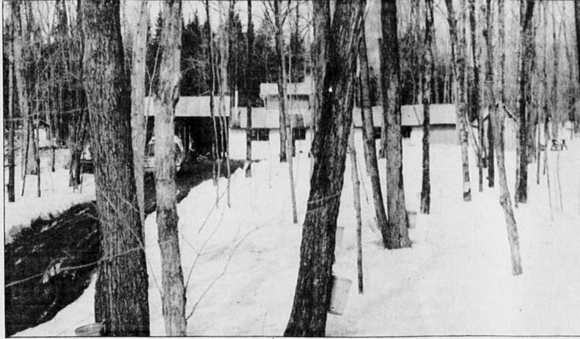
Une érablière traditionnelle de la région de Québec.

En ce sens, le dossier du dépérissement a constitué un événement médiatique majeur au Québec, à l'instar du waldsterben en Europe de l'Ouest. Les pluies acides venant des USA (et qui, malheureusement, transgressent toujours nos frontières et polluent nos lacs) ont été