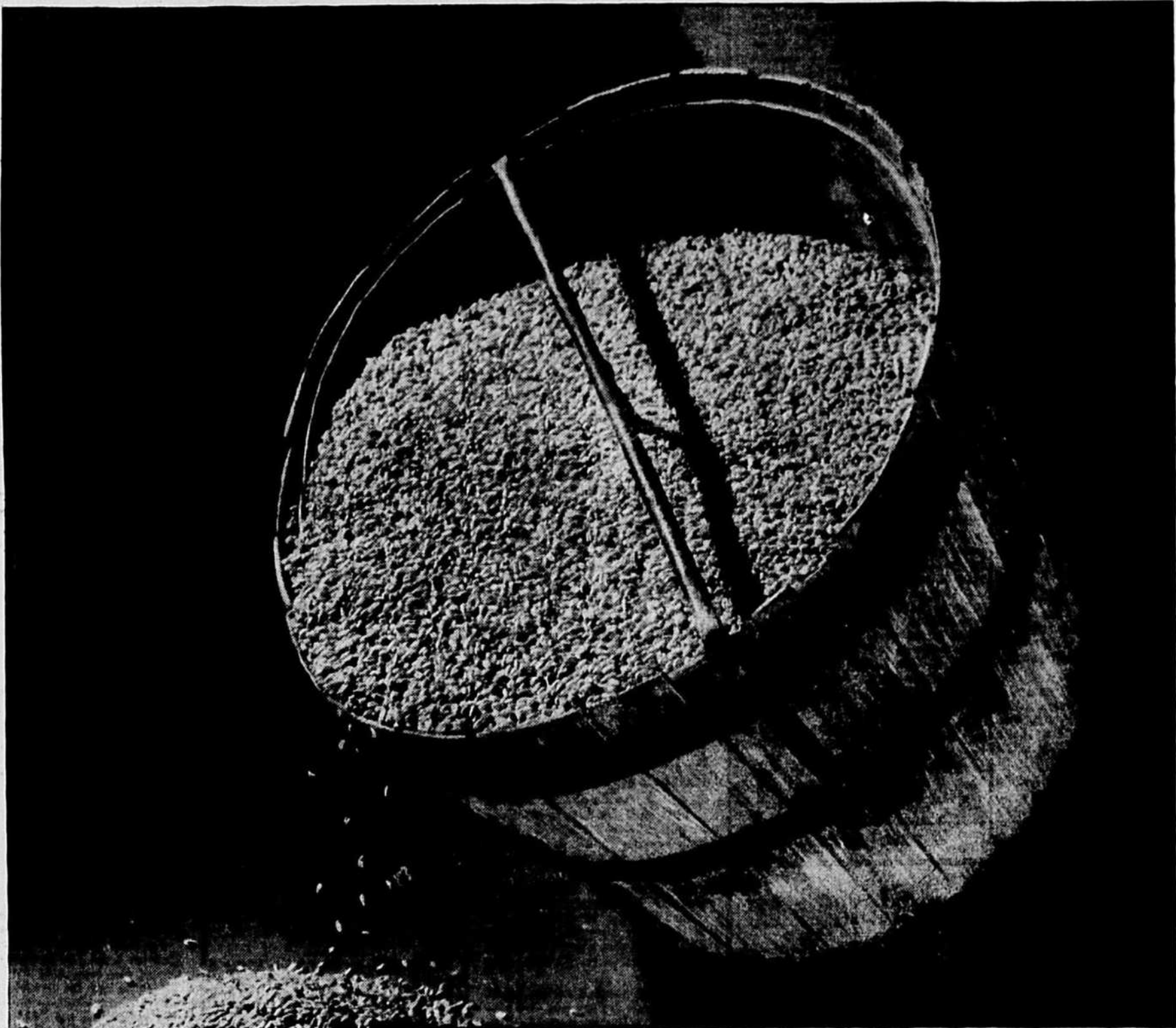
Cette mesure d'un minot, conservée au Musée du Château de Ramessay, Montréal, est, croit-on, la seule qui existe encore. Elle était en usage au Canada durant le Régime Français (avant 1759).

Chez nous, Herr Hitler, il y a tout ce qu'il faut de blé, tout ce qu'il faut de ressources, pour fabriquer une quantité quasi-illimitée d'alcool pour la guerre—si une nuit nos Lancasters et leurs bombes de 8,000 livres ne survolent pas Essen, Cologne ou Berlin, ne pensez pas que c'est parce qu'il nous en manque—la seule raison c'est que la température n'est pas propice à un raid. Quand votre "Tirpitz" recevra une bordée de mitraille des canons de 14 pouces de nos cuirassés, vous pourrez en faire porter le blâme à l'alcool qui nous permet de fabriquer des obus dévastateurs. Oui, Herr Hitler, vous êtes bien embêté. De toutes nos distilleries, au Canada et aux États-Unis, coule un flot ininterrompu d'alcool à haute preuve pour fins de guerre. Et vous pouvez être sûr, Herr Hitler, que ce flot ne sera contenu que lorsque votre dernier canon aura été encloué.