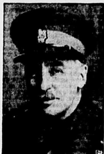
LE GENERAL STUART