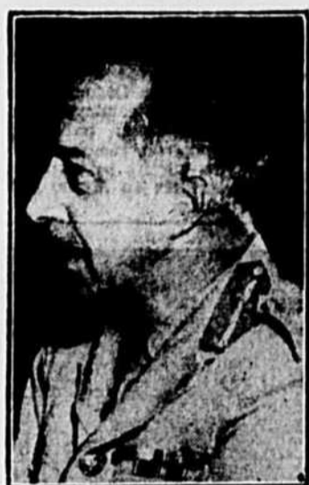
LE GENERAL CRERAR