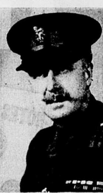
Le ministre de la Défense nationale, l'hon. L. Ralston, a annoncé en fin de semaine la promotion du brigadier Georges-P. Vanier, D.S.O., M.C., au grade de major-général. Cette promotion est entrée en vigueur le 1er janvier. Grand soldat et grand diplomate le major-général Vanier était jusqu'à récemment commandant du district militaire no 5 (Québec). Dernièrement, il était nommé ministre du Canada auprès des gouvernements alliés en exil à Londres. Il représentera aussi notre pays auprès du Comité national français dirigé par le général de Gaulle, chef de la France combattante.