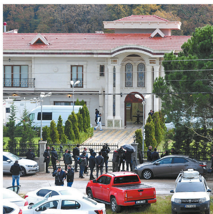
La police turque a fouillé lundi la villa située au sud d'Istanbul d'un citoyen saoudien soupçonné d'être impliqué dans le meurtre de Jamal Khashoggi.

Un drone, un chien et des véhicules de pompiers ont été déployés sur place, poursuit l'agence, qui ajoute que des échantillons ont été prélevés dans le puits de la maison.