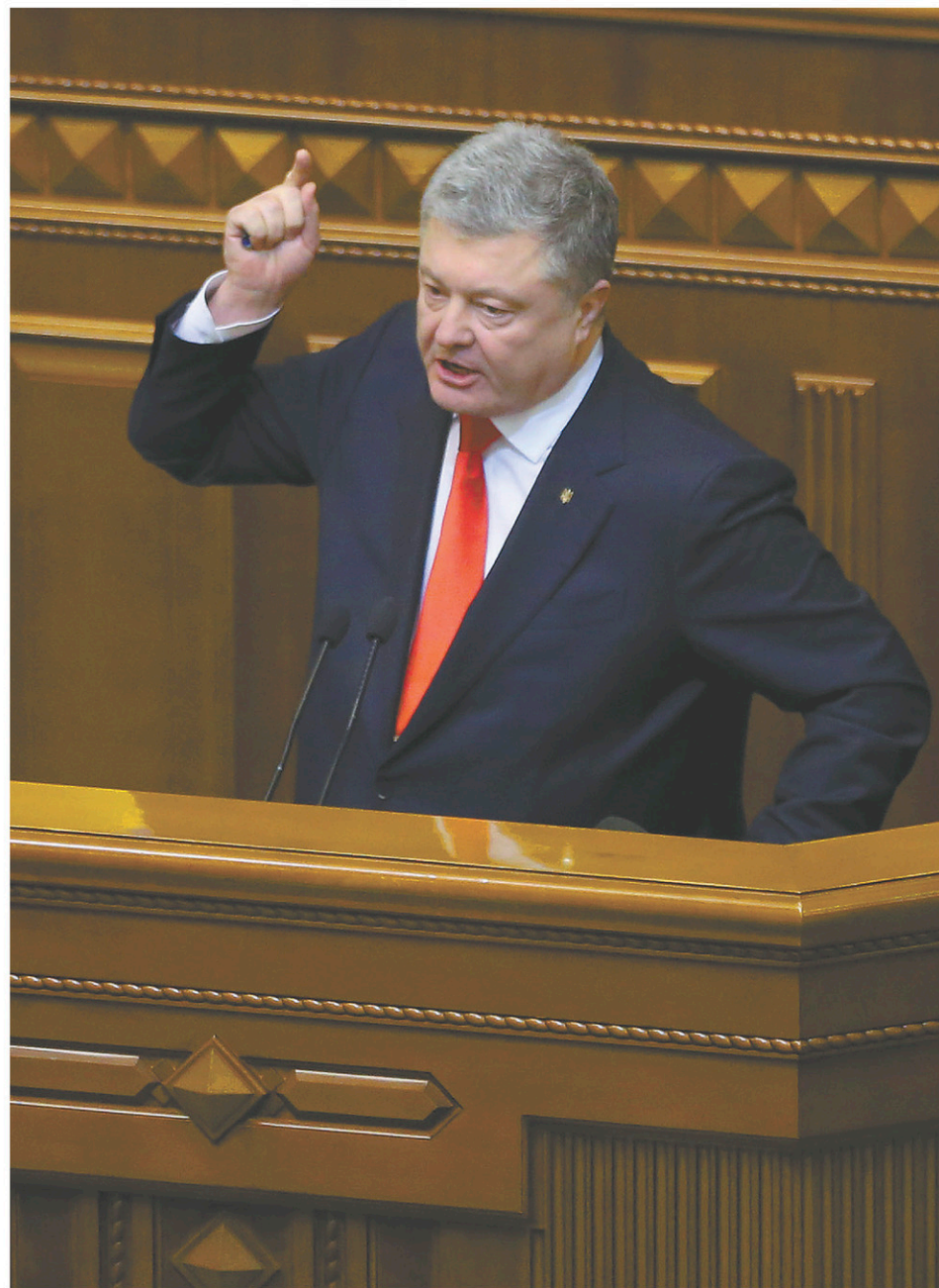
Le Parlement ukrainien a voté lundi pour imposer la loi martiale dans certaines parties du pays afin de lutter contre ce que son président Petro Porochenko a qualifié « d'agression croissante » de Moscou.

Le porte-parole du Kremlin a défendu la Russie, qui a agi « en stricte conformité » avec « le droit international ». Selon lui, c'est « l'intrusion de navires » ukrainiens « dans les eaux territoriales » russes qui a provoqué la riposte des garde-côtes.