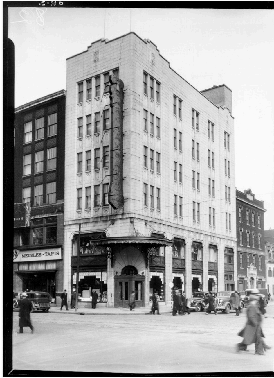
Photo datant du 1 er avril 1936

On pourrait penser que ces enseignes ne sont pas importantes, que ce sont simplement de vieilles choses. Mais elles renferment une histoire riche. Toutes les personnes qui viennent voir les affiches que j'ai récupérées ont une expérience à raconter.