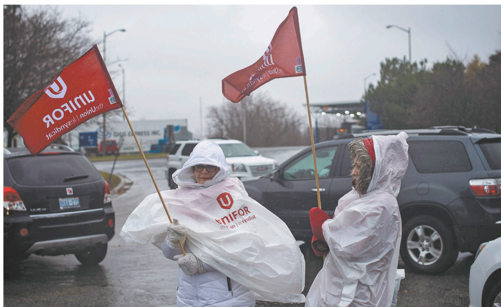
Des syndiquées de General Motors devant l'entrée de l'usine d'assemblage à Oshawa, lundi

Le ministre Bains a rappelé que le gouvernement Trudeau avait investi 389 millions dans 37 projets du secteur automobile depuis son élection en 2015.