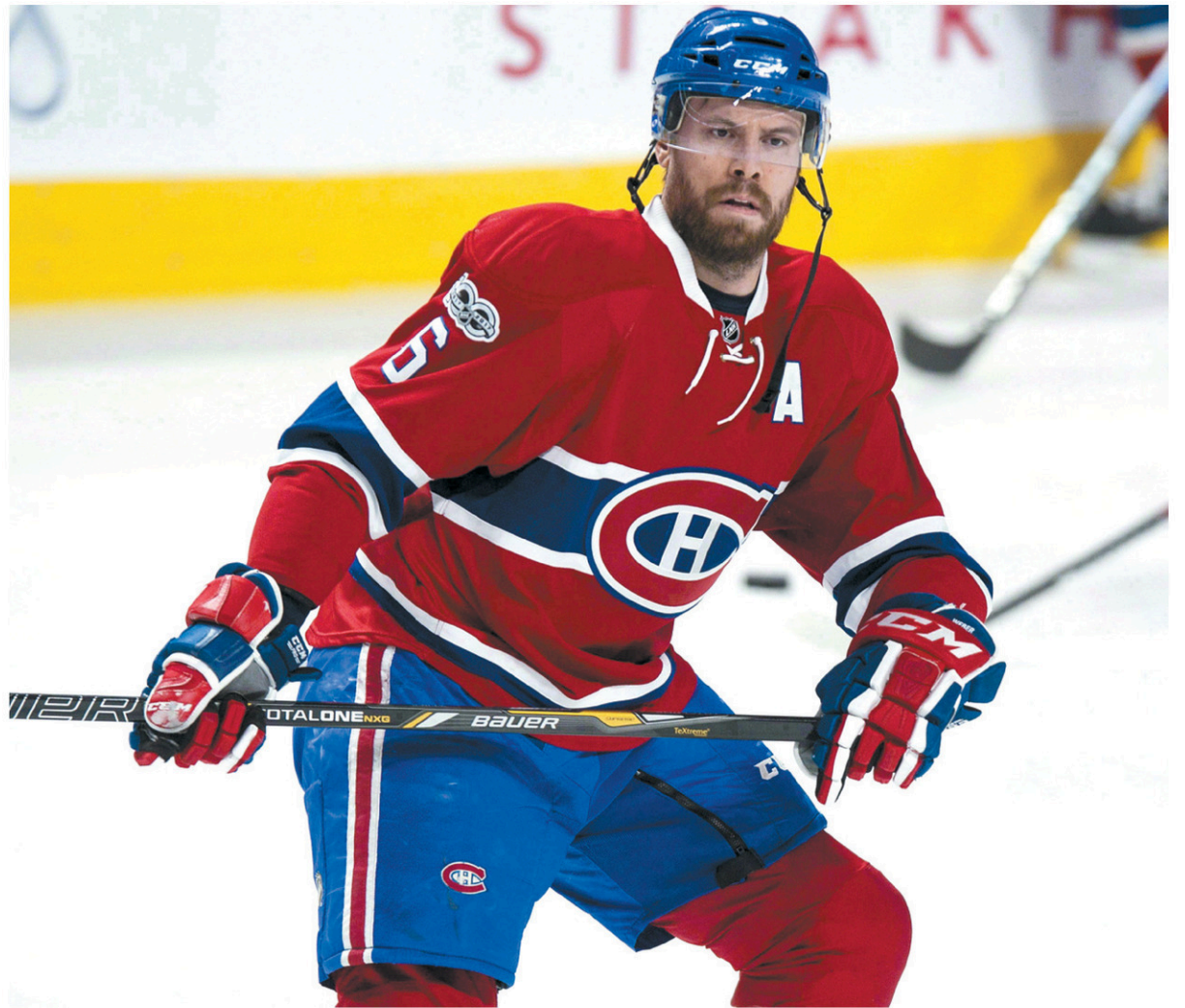
Shea Weber affrontera mardi soir les Hurricanes de Caroline après une longue convalescence.

Weber s'entraînait depuis déjà plusieurs semaines avec ses coéquipiers. Tout le monde chez le Canadien s'attend à ce qu'il fasse rapidement honneur à son étiquette de défenseur numéro un.