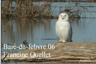
Baie-du-febvre 06 Francine Ouellet

Gratuit pour membre, 3$ pour non membre du club