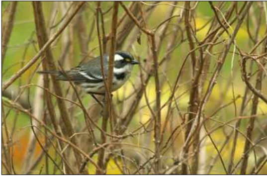
Errata: Nov 2006 Paruline grise femelle à l'Île Ste-Hélène