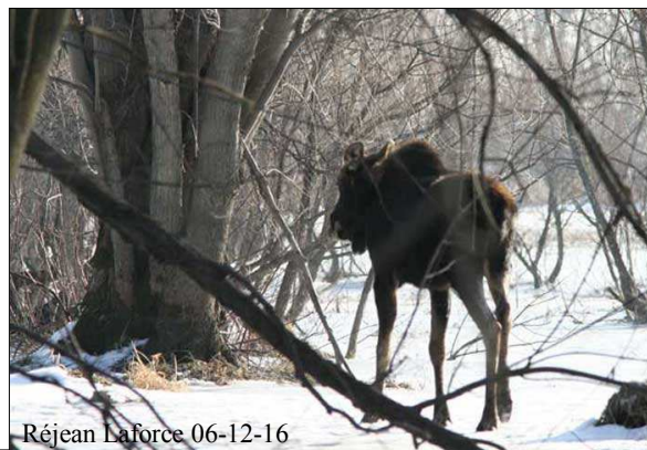
Réjean Laforce 06-12-16

place pour voir son casse-croûte, Étourneaux sansonnet et Vachers à tête brune s'en donnant à cœur joie au sol près d'une grange. On a tout le loisir de les compter et de bien identifier les Vachers femelles.