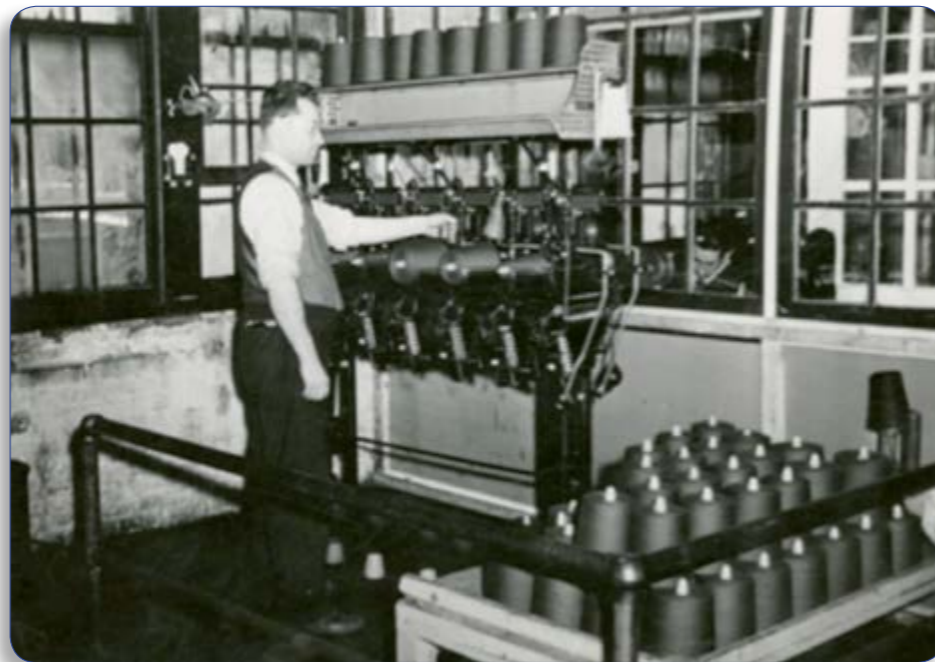
Fileuse en action sous la supervision de l'opérateur/ Photographe inconnu- (P051/i-PH-0010).

L'industrie du textile au Québec a largement profité de la période de la guerre et de l'après-guerre (Plan Marshall, Guerre de Corée). Son déclin commence au début des années '60 avec la pénétration des produits textiles importés au Canada.