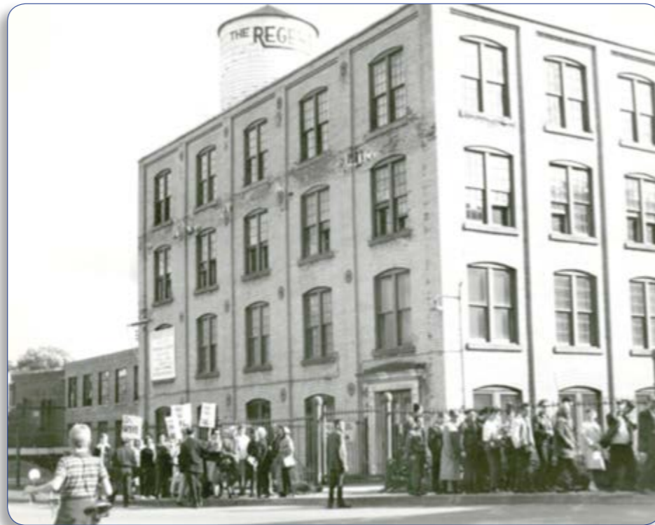
Piquetage des ouvriers en grève devant l'usine/ Photos Select Inc.- 1963.- (P051/i-PH-0025)

Les deux fonds d'archives de la Regent et de Tricofil représentent dans ce sens une leçon de gestion d'une valeur inestimable pour les décideurs tant entrepreneurs que gouvernementaux, syndicaux et financiers. ●