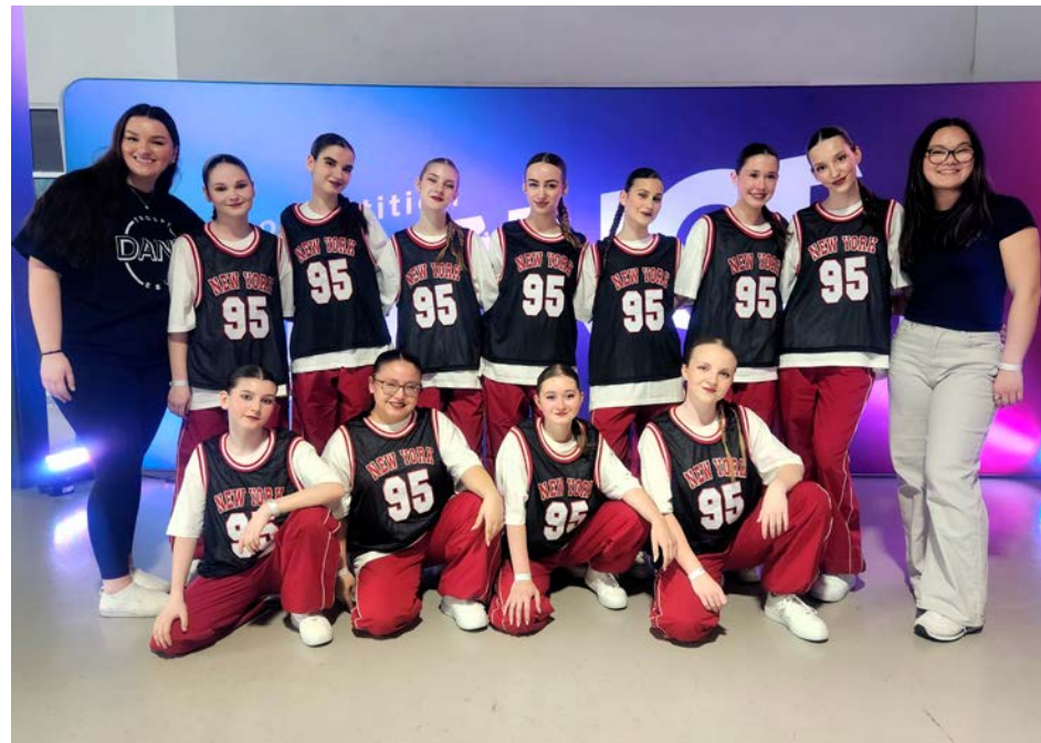
La troupe Soul a présenté un numéro de hip-hop à la compétition IDance à Brossard.

Chaque année, les élèves participent à certaines compétitions et performant lors de différents spectacles organisés par l'école. Cette année était toutefois