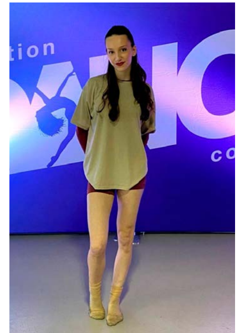
Anne-Florence y a participé pour la première fois comme soliste.