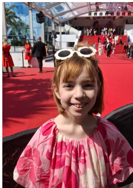
Sienna au pied du tapis rouge du Festival de Cannes.

« C'était le plus long applaudissement de ma vie. » - Sienna Feghouli