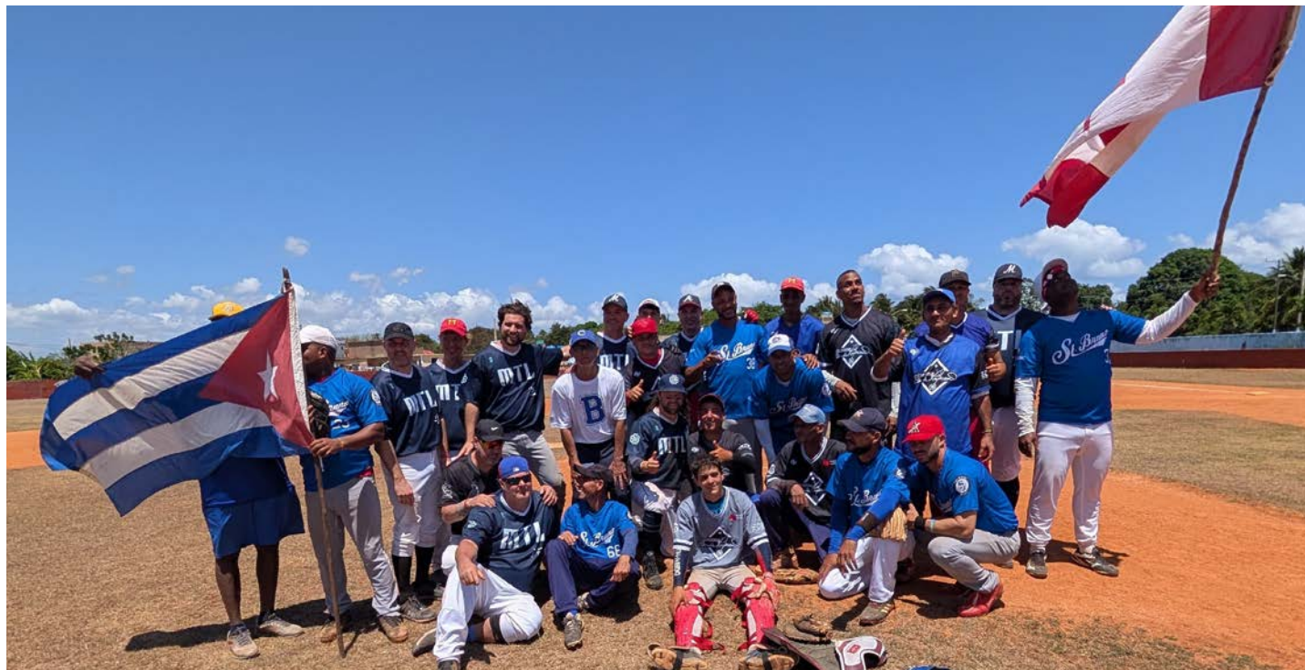
Les chandails de baseball de Saint-Bruno seront portés par des joueurs cubains.

Ici, l'Association de baseball mineur de Saint-Bruno a entendu parler de cette initiative. À la suite d'un grand ménage, il y a deux ans, dans un espace de rangement dédié au matériel sportif des équipes, plusieurs articles désuets ont pu être remis pour aider les jeunes à Cuba. « Pour nous, acheter du nouveau matériel s'avère souvent