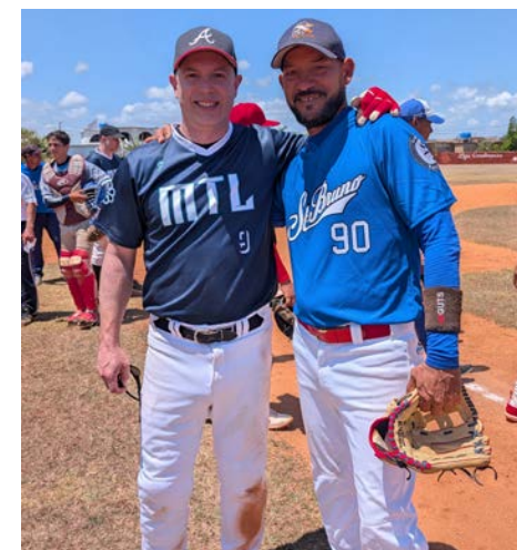
Le baseball est le sport national de Cuba.