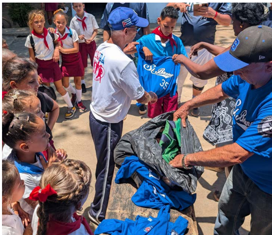
L'Association de baseball mineur de Saint-Bruno a pu envoyer des chandails et du matériel à Cuba.