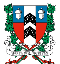
Ludovic Grisé Farand, maire

Le 7 juin, profitez de la Fête du voisinage pour réunir vos voisins et partager un bon moment! Même s'il est trop tard pour demander la fermeture d'une rue, vous pouvez tout de même organiser une fête dans votre cour, votre entrée ou un des beaux parcs de la Ville. Buffet partagé, barbecue, concours de desserts, 5 à 7... toutes les formules sont permises! L'important, c'est de créer des liens et de célébrer la vie de quartier.