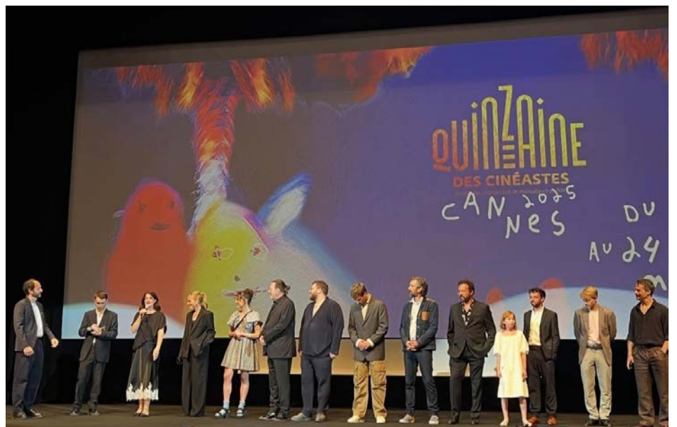
L'équipe du film au moment de la projection en première mondiale à Cannes.

Amour apocalypse raconte l'histoire d'un homme de 45 ans hypersensible, propriétaire d'un chenil, qui tombe éperdument amoureux de Tina, une femme solaire à la voix douce. Le film prendra l'affiche au Québec le 8 août prochain.