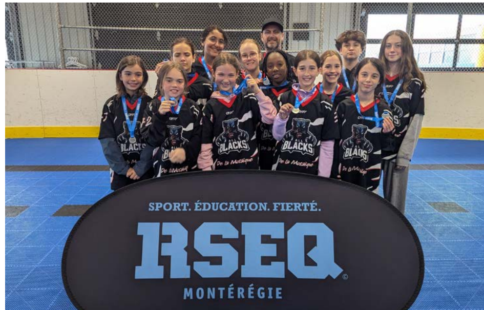
Les filles des All-Black ont quitté la compétition avec la médaille d'argent.

Et pour cause, car pour les All-Black, le tournoi s'est amorcé avec deux défaites. Nonobstant ces deux revers, les représentantes de Saint-Basile-le-Grand se sont retrouvées dans l'une des demi-finales. « Elles ont progressé tout le long du tournoi. »