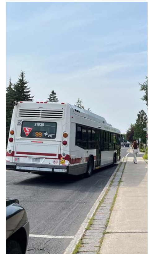
Saint-Bruno-de-Montarville fait une demande auprès de l'ARTM.

Rappelons qu'une fermeture complète du REM est planifiée à partir de juillet prochain pour une période indéterminée afin de permettre des travaux correctifs majeurs. Selon Saint-Bruno, ces travaux viendront accentuer davantage la pression sur le réseau d'autobus métropolitain et sur les usagers qui dépendent du transport collectif pour se rendre au centre-ville de Montréal.