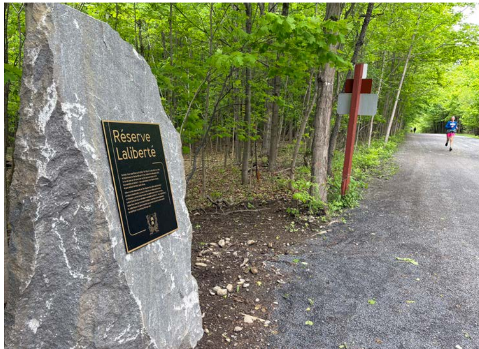
L'entrée de la Réserve Laliberté est identifiée par une pierre sur laquelle une plaque a été installée.