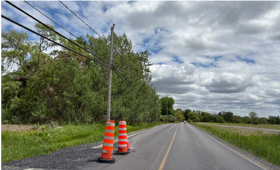
La montée Sabourin, qui a été refaite l'automne dernier, présentait quelques problèmes à sa surface.

L'état de la montée Sabourin, à Saint-Bruno-de-Montarville, laisse à désirer, selon une citoyenne de ce secteur. Des réparations ont été effectuées la semaine dernière.