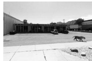
3081 Valmont Road, Boulder, Colorado

Salle Pierre-Beaudoin, du 20 juin au 30 août 2015