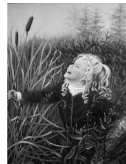
Cueillir l'instant.

Hall du Moulin et Salle des courroies, du 6 juin au 6 septembre 2015.