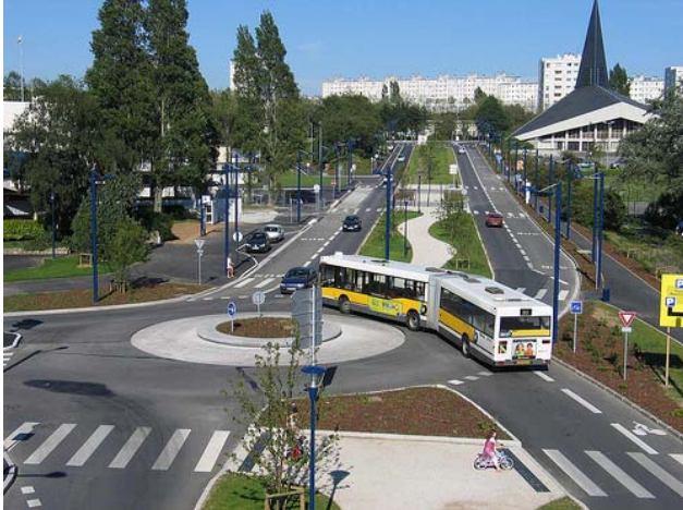
Figure 2 Un carrefour giratoire multi-modal

À Brest, en France, un carrefour giratoire conçu pour tous les modes de circulation sur les voies publiques : transport actif, transport collectif, transport motorisé individuel. D'autres types de giratoires existent. Nous présentons en annexe quelques variations.