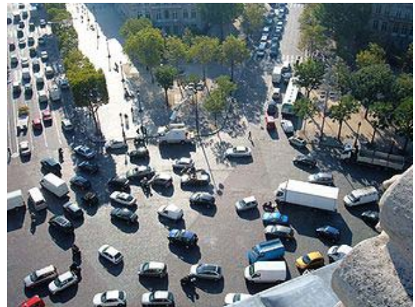
Figure 1 Le rond-point de l'Arc-de-Triomphe, à Paris

Les deux dispositifs partagent en effet des caractéristiques communes, dont une forme circulaire avec entrées et sorties multiples et un îlot central. Cet îlot est parfois accessible aux piétons dans le cas des ronds-points. De manière générale, ces deux dispositifs se caractérisent aussi par l'absence de panneaux d'arrêt ou de feux de circulation 1 .