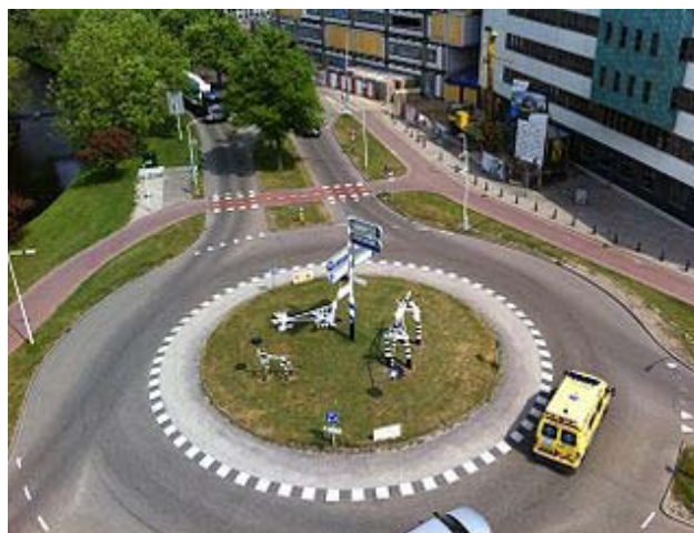
Figure 5 Une piste cyclable en marge de la chaussée d'un giratoire

Celle-ci est généralement située à une ou deux longueurs de voitures en retrait de l'endroit où les voies d'accès croisent les voies circulaires. Le piéton emprunte la même voie.